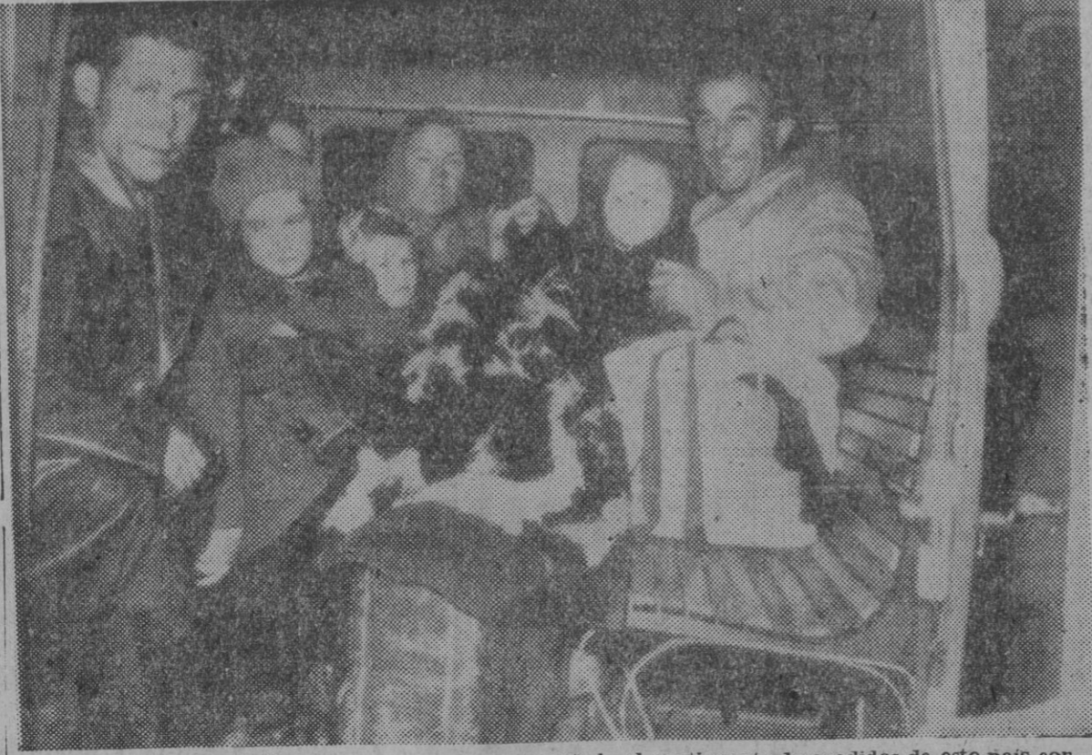
Los sangrientos sucesos de Hungría han incrementado el contingente de evadidos de este país con destino a Austria. Este es uno de los camiones últimamente llegados a la frontera austriaca y acogidos al elemental derecho de asilo.