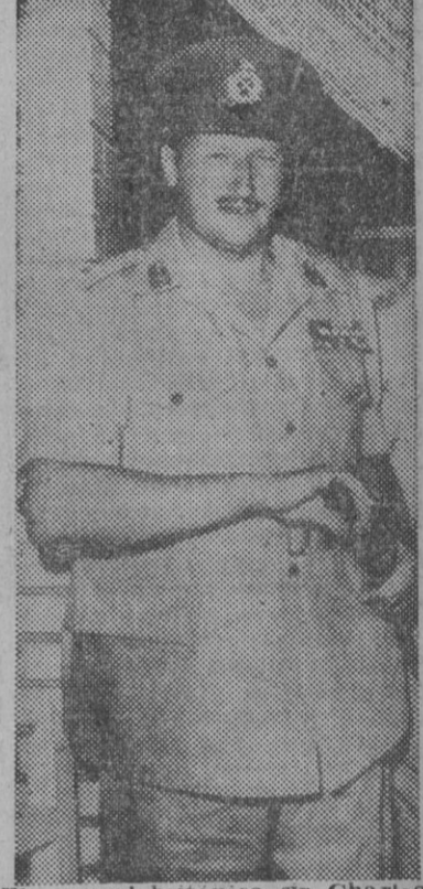
El general británico sir Charles Frederick Keightley, con más de treinta años de experiencia en el Oriente Medio que se ha hecho cargo del mando de las operaciones militares en el Canal de Suez.

egipcia por un crucero británico, cuyo texto es el siguiente: «El Almirantazgo informa que el crucero de S. M. "Newfoundland" (Terranova), que realiza operaciones de protección en el Golfo de Suez, avistó a última hora del miércoles una fragata egipcia, que se negó a responder a las señales que le fueron hechas desde el buque británico. Por tanto, fué hundida y sus supervivientes fueron trasladados a bordo del "Newfoundland". — Efe. INFORME OFICIAL DE EGIPTO AL CONSEJO DE SEGURIDAD, DEL ATAQUE ANGLOFRANCO EL CAIRO, 1. — Egipto ha informado oficialmente al Consejo de Seguridad de las Naciones Unidas que Gran Bretaña y Francia han atacado su territorio.