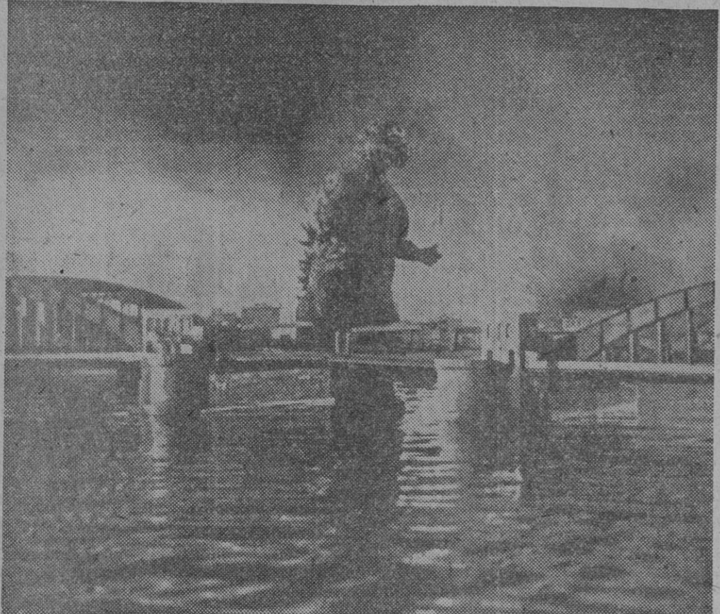
COMUNICAN DE TOKIO QUE OPERADORES JAPONESES Y AMERICANOS HAN CAPTADO CON SUS OBJETIVOS LA MARCHA DEL GIGANTE MONSTRUO SOBRE LAS CIUDADES Y SU HORRIBLE DESTRUCCION