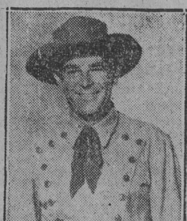
Rod Cameron, el infundible «astro» de la pantalla americana...