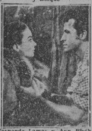
Fernando Lamas y Ann Blyth, en una secuencia de la encantadora película...