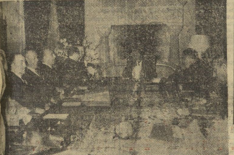
LA CORUÑA. — S. E. el Jefe del Estado preside el Consejo de ministros celebrado en el palacio de Méirás.

FRANCO, ACLAMADO POR LA MULTITUD En primer lugar, el Jefe del Estado inauguró la Escuela del