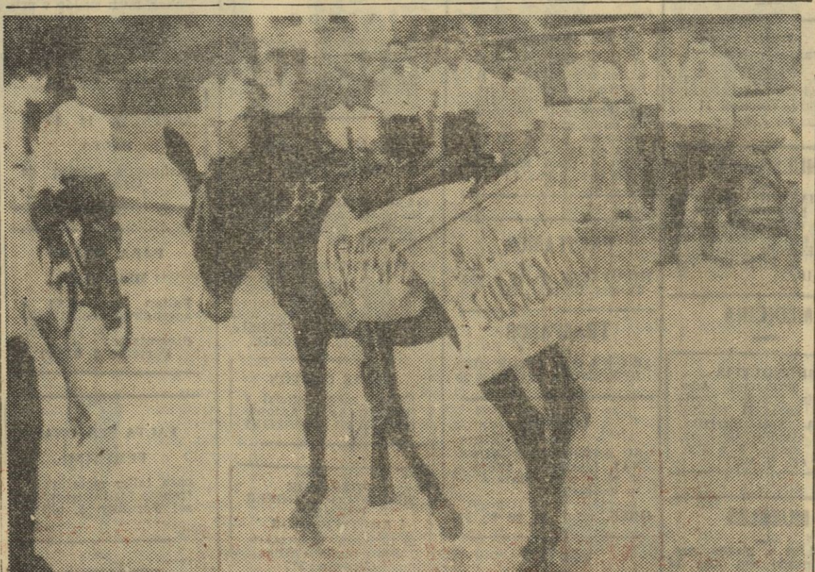
El mariscal sir John Harding, gobernador de Chipre, lanzó hace unos días un ultimátum a los nacionalistas chipriotas conminándoles a rendirse. A guisa de respuesta, los patriotas de Chipre hicieron pasar por las calles de Nicosia a ese flamante borriquito, portador de un viejo y deteriorado fusil y la inscripción: '¡Mariscal, me rindo!'.