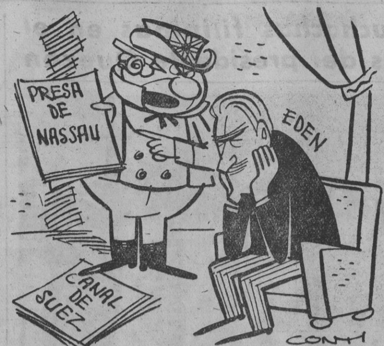
John Bull. — Hice cuentas y arreglar este asunto creo que nos habría resultado mucho más barato.