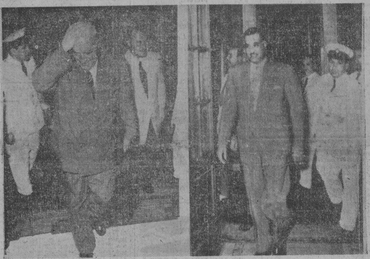
A la izquierda, el presidente de la Comisión pentapartita encargada de presentar al Gobierno egipcio la propuesta de Londres sobre el problema del Canal de Suez, Mr. Menzies, a su entrada a la residencia del presidente Nasser para asistir a la tercera reunión de las celebradas con dicho motivo. A la derecha, el presidente Nasser entrando en el salón donde se celebran las conversaciones.

PARIS, 6. (Urgente). — Fuentes informadas comunican que el Consejo celebrado en esta capital al que han asistido representaciones de 15 países de la OTAN, ha expresado su apoyo unánime al principio de control internacional del Canal de Suez sostenido en la pasada conferencia de Londres. "Figaro" dice esta mañana que Alemania Occidental, Bélgica, Turquía y Canadá, han apoyado la actitud francobritánica en la disputa con Egipto. "Combat" dice que uno de los delegados, declaró después de la reunión: "No se ha registrado HOY SE HA REUNIDO EL GOBIERNO INGLES PARA TRATAR DEL APOYO DE LA NATO LONDRES, 6. — Los ministros del Gabinete británico a, quienes más directamente afecta la crisis del Canal de Suez, se han reunido hoy para tratar de los últimos acontecimientos de la disputa. También se ha reunido el «Gabinete» del partido laborista, y se espera que insistan en las demandas socialistas para que no sea empleada la fuerza en Suez sin la que el presidente egipcio ha formulado sobre el futuro del Canal de Suez. No se han facilitado detalles acerca de las sugerencias de Nasser, pero Menzies ha declarado a los periodistas: «Mis conversaciones con Nasser han sido aplazadas sin fijar fecha para su reanudación. Pero las conversaciones continuarán». Un portavoz de la Comisión pentapartita de la Conferencia de Londres, añadió que Menzies tie-