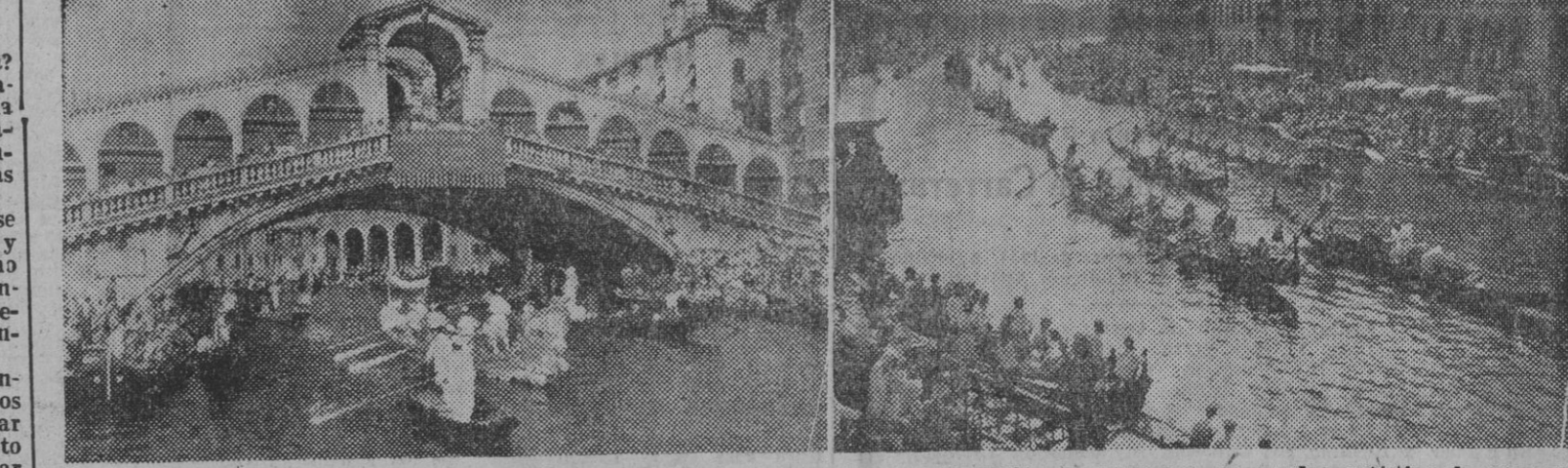
Durante la vigésimo octava Regata Anual Histórica, las vistosas góndolas venecianas componen un cuadro artístico de marcado sabor retrospectivo, a su paso, en primer lugar, bajo el puent e del Rialto, y, en segundo, en su recorrido por el Gran Canal.