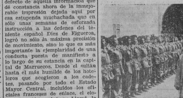
RABAT. — S. M. I., el sultán de Marruecos acompañado del príncipe heredero y de otras personalidades de su Gobierno...