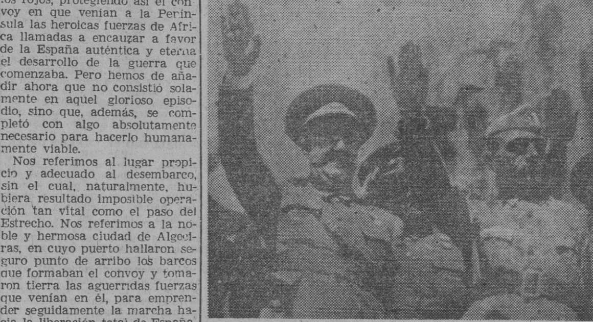
El general Alvarez Arenas y el entonces coronel don Manuel Coco Rodríguez, presencian el desfile de las tropas, momentos después de haberle sido impuesta a este último, en la barcelonesa Plaza de la Victoria, la Medalla militar ganada con la heroica decisión que puso desde el primer momento en manos de la España auténtica la ciudad y puerto de Algeciras, posición clave para el triunfo del Glorioso Movimiento Nacional.