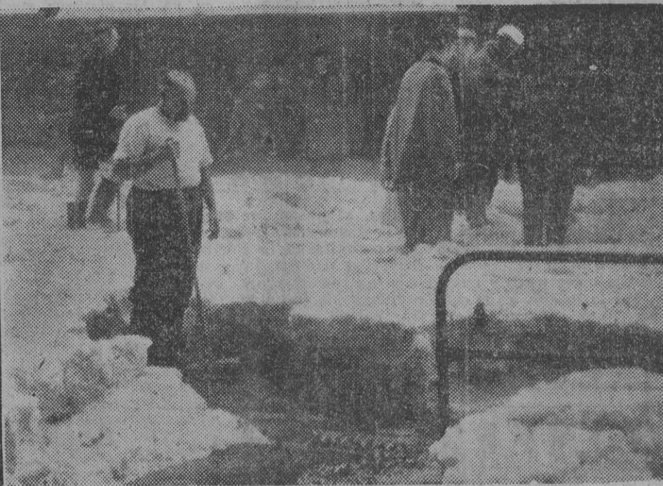
No son escenas de Navidad, a pesar de las apariencias. Se trata de la nevada de casi un metro de espesor que cayó en Tunbridge Wells, hace pocos días, durante los grandes temporales que han afectado al sur de Inglaterra...