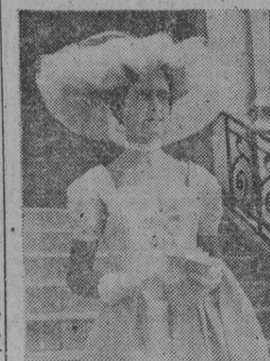
PARIS. — Uno de los modelos que se vieron en el hipódromo de Auteuil con ocasión de una de las recientes carreras.