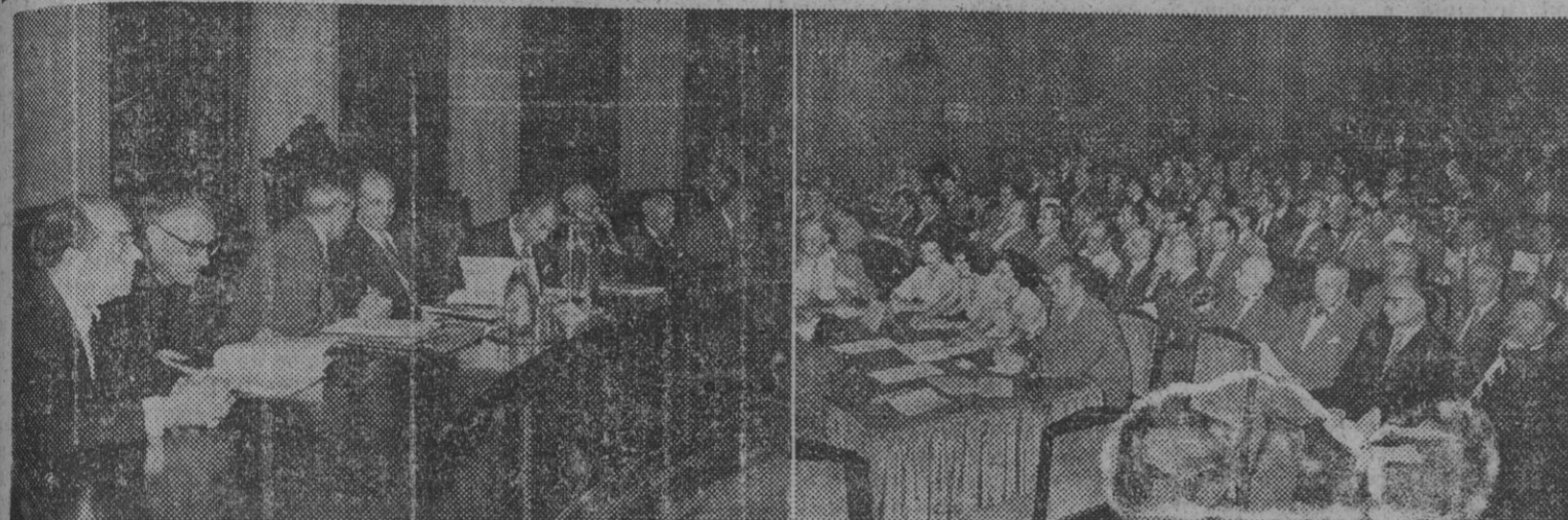
Presidencia del III Pleno del Consejo Económico Sindical, clausurado ayer tarde, en el Fomento del Trabajo Nacional. — 2. Aspecto del salón, totalmente lleno de consejeros.