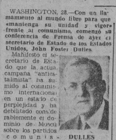
WASHINGTON, 23.—Con un llamamiento al mundo libre para que «mantenga su unidad y vigor» frente al comunismo, comenzó su conferencia de Prensa de ayer el secretario de Estado de los Estados Unidos, John Foster Dulles.

Indicó que no podía coincidir con Pienau en su apreciación de la forma en que el mundo libre debe aprovechar la tendencia del bloque soviético a conceder libertades a los pueblos de allende el «telón de acero»