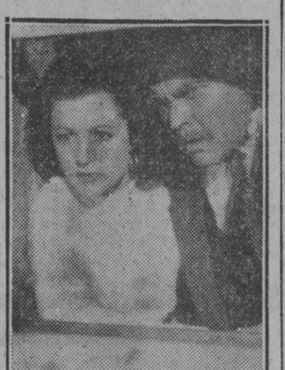
Orson Welles y Margaret Lockwood, en 'Lío en el Valle', magnífica película en tecnicolor...

Gaudí es el precursor de la inquietud artística de nuestro tiempo