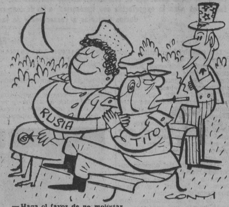
—Haga el favor de no molestar.