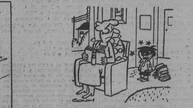
—Me he pegado con Juanito porque decía que su padre es más tonto que el mío.