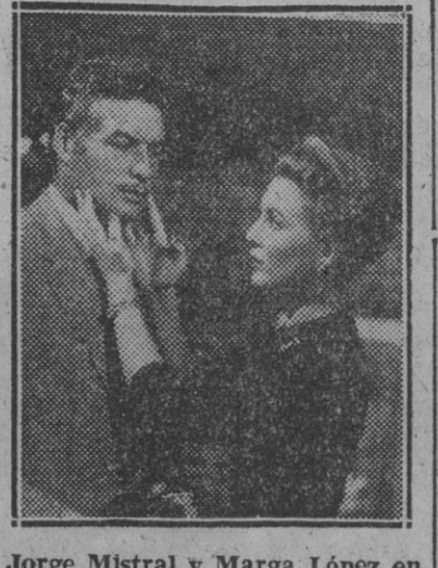
Jorge Mistral y Marga López en una interesante escena de la película 'Orquídeas para mi esposa'...