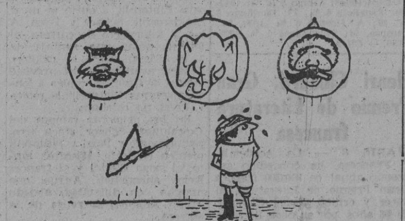
TROFEOS DE CAZA