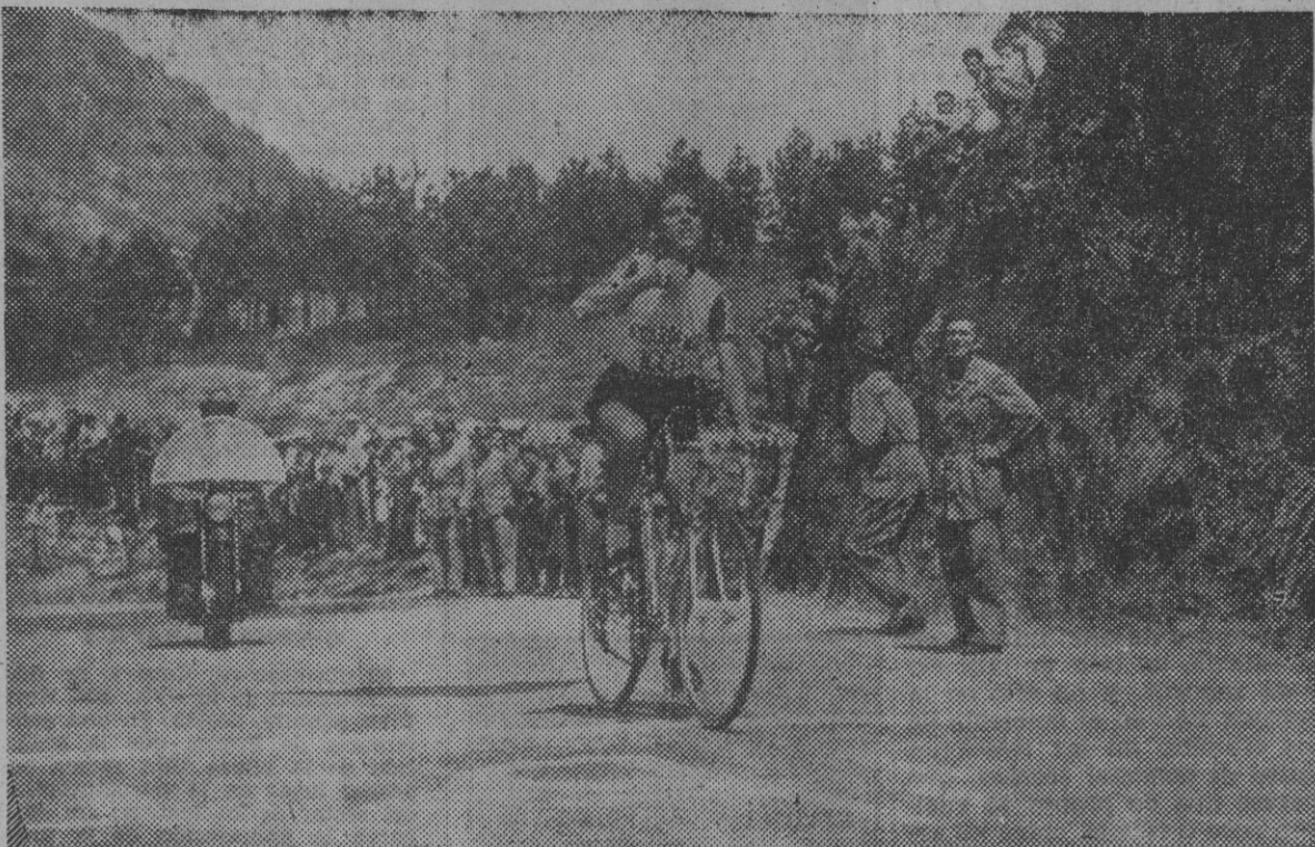
Federico Martin Bahamontes está realizando una excelente carrera en la Vuelta a Italia. Victorioso en el Gran Premio de los Apeninos, "el Águila de Toledo" impuso su ley irresistible en todos los collados. La soltura de Bahamontes queda reflejada en la foto, al pisar la cima del Paso de Bacco. Ahora, en los Dolomitas, Bahamontes ha sostenido una feroz lucha con su gran adversario: Charly Gaul.