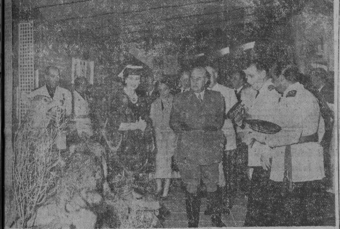
El Jefe del Estado, acompañado de su esposa, de los ministros de Agricultura y de Trabajo y otras personalidades, durante la inauguración de la III Feria Internacional del Campo.

Le dieron la bienvenida a la entrada del recinto los ministros de la Gobernación Industria, Comercio, Trabajo, Agricultura e Información y Turismo. Con ellos se encontraban el delegado y secretario nacional de Sindicatos, comisario general de la Feria, subsecretarios del Aire, Agricultura, Obras Púublicas, Gobernación y Trabajo, alcalde y presidente de la Diputación, capitán general, gobernadores civil y militar, los gobernadores de todas las provincias españolas con los delegados nacionales de Sindicatos, Obras Púublicas, Comercio, Industria y Servicios, así como un gran número de embajadores, entre los que se hallaban los de los Estados Unidos, Colombia y Paraguay. A la esposa de S. E. el Jefe del Estado le fué entregado un