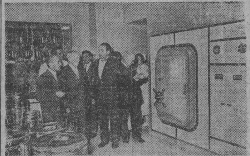
Un grupo de médicos ingleses de la Facultad de Birmingham especialistas en "medicina social" visitan la Residencia Sanitaria "Francisco Franco", de nuestra ciudad, que recorrieron detenidamente.

Médicos ingleses en la residencia "Francisco Franco"