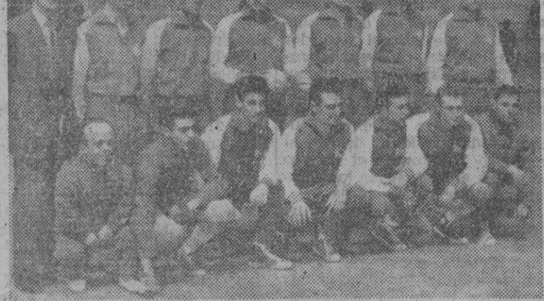
El equipo del Granollers, brillante campeón de España, "a siete".

dos entre los que se formará el equipo representativo español que ha de enfrentarse al de Portugal, el sábado, por la noche en el Palacio Municipal de los Deportes. La lista es la siguiente: Porteros: Sánchez, Font, Gimeno y Espinosa. Defensas: Pena, Miner, Cañadel, Casajuana, Blanco y Puig. Delanteros: Fontdevila Pérez Mo-