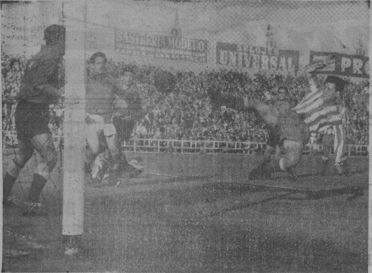
La oportunidad e inteligencia de Benavidez están allí donde la ocasión clara surge. El buen delantero centro no desaprovechó ésta que le brindó un cabezazo de Areas, y en acrobática postura, envió el balón a la red, tranquilizando a la parroquia de Sarriá con el 2-0. (Foto Pérez de Rozas).