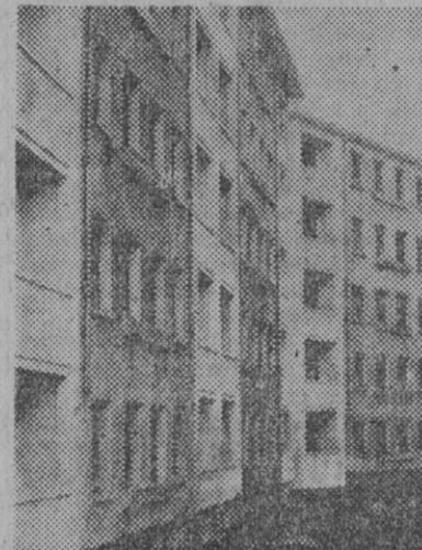
Aspecto exterior del almacén siniestrado. Las casas contiguas, afectadas por el fuego, han sido desalojadas.

que estaban almacenados, con el calor del fuego fueron despedidas a la calle, cayendo junto a la churrería y arbolado, que sufrieron las consecuencias del violento fuego, quedando también averiado el cable de transmisión de electricidad de los tranvías y alumbrado público.