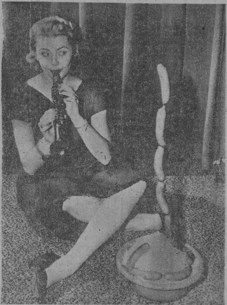
CHICAGO (Illinois). — No sabemos si son los dulces acordes del clarinete o los encantos de Hillevi Rombin "Miss Universo 1955", los que obran el milagro. Hillevi dice que no es ningún secreto y en cualquier caso mañana empieza la "Semana de Franckfurt" y todo el mundo podrá averiguar el misterio de las salchichas.