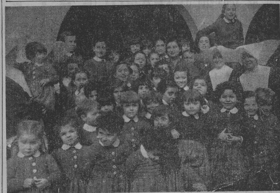
Niños huérfanos españoles, acogidos en el Hospital Español de París, rodean a la marquesa de Villaverde durante la visita que ésta hizo a dicho centro momentos antes de emprender el viaje de regreso a España.