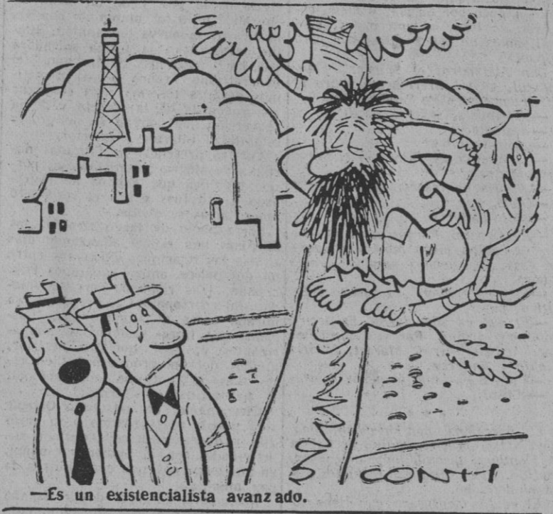
—Es un existencialista avanzado.