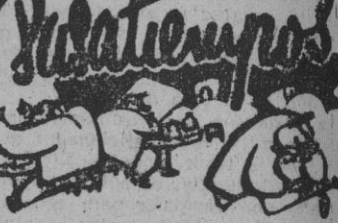
Jeroglífico núm. 3.506

Estos planes en el Extremo Oriente se espera den también por resultado un más estrecho contacto entre el Estado Mayor francés de Indochina y el Departamento australiano de Defensa en Melbourne. Se cree que el mariscal francés Juin, que actualmente se encuentra en Indochina, conferencia con el general Omar Bradley, jefe del Estado Mayor conjunto, inmediatamente después de su regreso a París, donde llegará, según ya se ha anunciado, para el 7 del próximo marzo. — Efe.