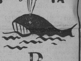
Solución al núm. 3.505