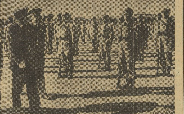
Con asistencia del ministro del Aire, teniente general Gonzalo Callarza, y otras personalidades, se han celebrado unos ejercicios de paracaidistas con motivo del quinto aniversario de la iniciación de sus actividades

El ministro del Aire presencia unos ejercicios de paracaidistas