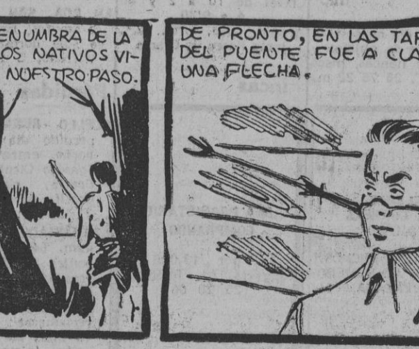
EN LA PENUMBRA DE LA SELVA LOS NATIVOS VIGILABAN NUESTRO PASO.