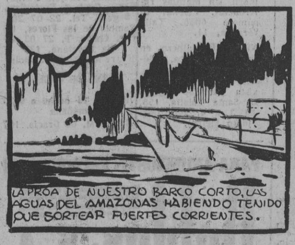
LA PROA DE NUESTRO BARCO CORTO, LAS AGUAS DEL AMAZONAS HABIENDO TENIDO QUE SORTEAR FUERTES CORRIENTES.