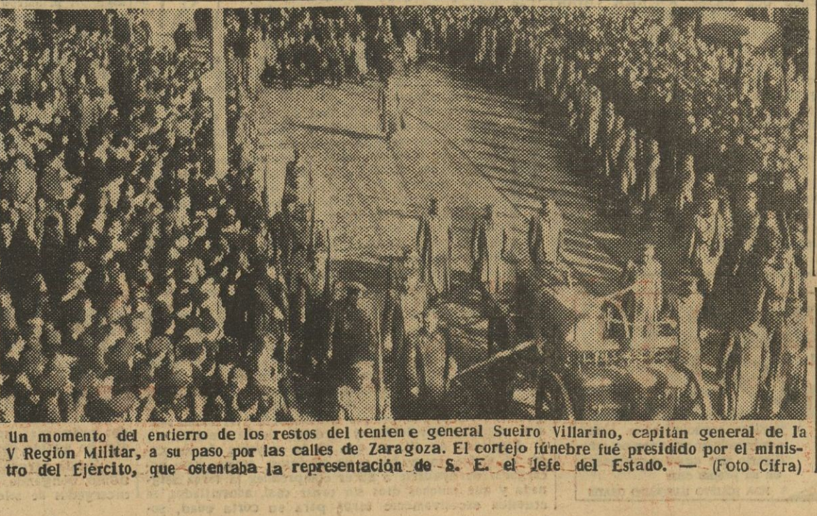
Un momento del entierro de los restos del teniente general Suro Villarino, capitán general de la V Región Militar, a su paso por las calles de Zaragoza. El cortejo fúnebre fué presidido por el ministro del Ejército, que ostentaba la representación de S. E. el Jefe del Estado.