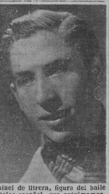
Rafael de Utrera, figura del baile clásico español, que próximamente hará su presentación en Barcelona

Figura del baile clásico español, que próximamente hará su presentación en Barcelona