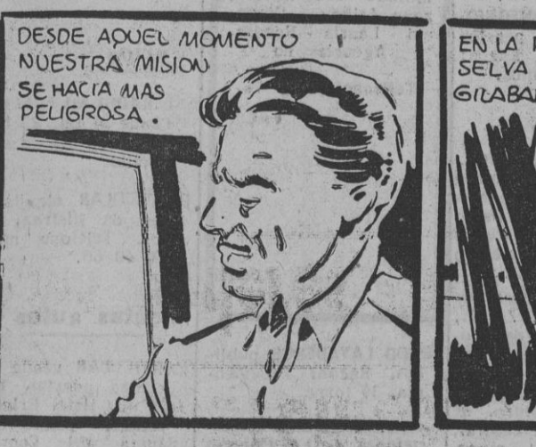
DESDE AQUEL MOMENTO NUESTRA MISION SE HACIA MAS PELIGROSA.