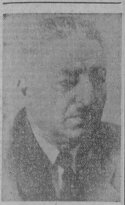
El ministro de Asuntos Exteriores de Siria, señor Rigal Zafer, que próximamente vendrá a España, invitado por el Gobierno español.