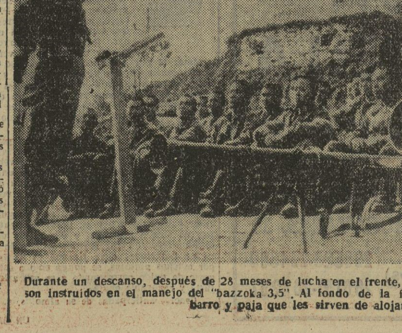
Durante un descanso, después de 28 meses de lucha en el frente, soldados de una división surcoreana son instruidos en el manejo del «bazooka 3,5». Al fondo de la fotografía, las chavolas de piedras, barro y paja que les sirven de alojamiento