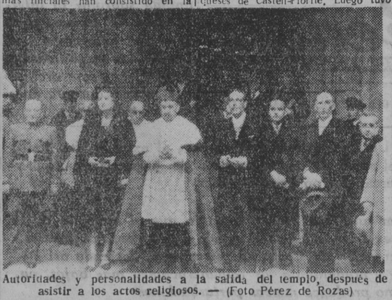
Autoridades y personalidades a la salida del templo, después de asistir a los actos religiosos.