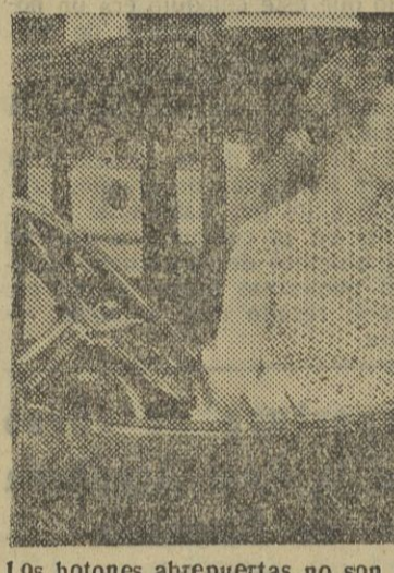
Los botones abrepuertas no son un "milagro" de la técnica moderna. Este "Franklin" del año 1914, que ocupan estas lindas señoritas de 1952, ya poseía este adelanto que ahora presentan los últimos modelos.

Estamos en Detroit, la ciudad consagrada a la fabricación del automóvil y a donde llegan, naturalmente, los ecos de los grandes certámenes que la industria europea organiza todos los años al llegar el otoño.