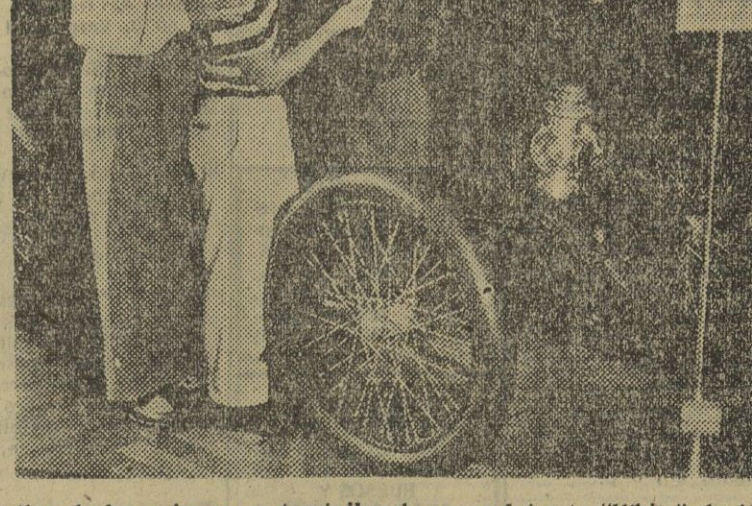
Uno de los primeros automóviles de vapor fué este "White" de 1902 que ofrecía la particularidad de un tubo de escape con dos salidas. Ahora se pretende otra vez fabricar automóviles de vapor para ahorrar gasolina.

Libros y Revistas extranjeras T. 283465. Barcelona