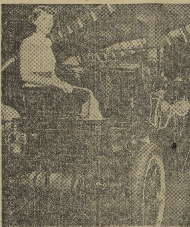
El "asiento suegra", un precursor del modelo "ahí te pudras", ya no era una novedad en este "Packard" modelo sport de 1906.

Hay maridos para las mujeres de 30 años Las mujeres de 30 años parecen condenadas a la soltería y, sin embargo, cada vez se casa más gente en Francia. ¿Por qué no encuentran maridos las mujeres de 30 años? ¿Es que son menos bonitas, menos atractivas que las otras?