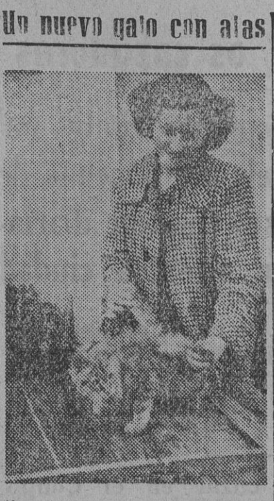
Un nuevo gain con alas