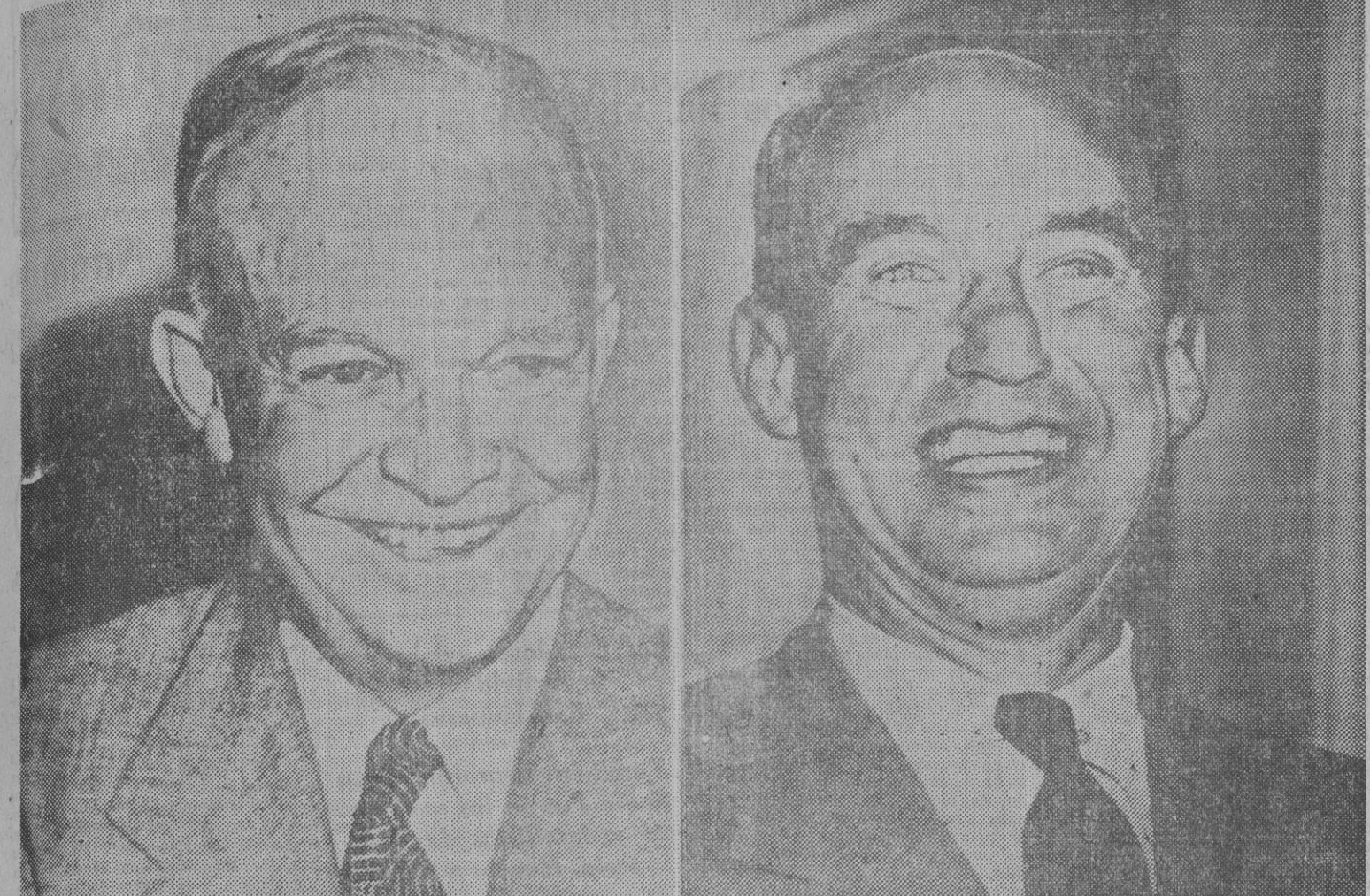
De cómo la cuestión de Corea ha podido influir en el resultado de las elecciones presidenciales norteamericanas, da idea esta composición fotográfica, en la que aparecen los dos candidatos, Dwight Eisenhower (izquierda) y Adlai Stevenson (derecha). Como se sabe, ambos sustentan distintos puntos de vista sobre la posible solución de la campaña coreana.

MARTES, 4 DE NOVIEMBRE DE 1952. — AÑO XII - NUMERO 3.560 - PRECIO DEL EJEMPLAR 70 CTS.