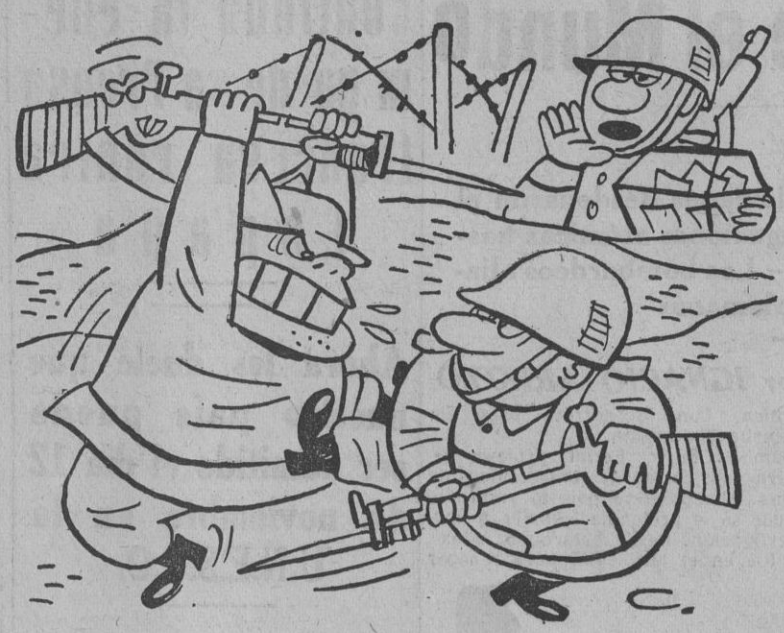
—¡Oye, John! ¡Deja eso un momento y ven a votar!

TOKIO, 4. — Tropas de primera clase, tanto chinas como norteamericanas, se han lanzado a las posiciones aliadas, en una serie de acciones que terminaron antes del amanecer con la derrota de los rojos. Más de setecientos norteamericanos sostuvieron un ataque de cuatro horas de duración en el frente oriental, precedido de un fuego de barrera, en el que se dispararon más de 5.000 proyectiles de artillería y morteros. Las tropas de las Naciones Unidas se mantuvieron en sus posiciones e hicieron al enemigo un centenar de muertos y heridos, por lo menos. Más hacia el noroeste, los rojos atacaron las posiciones situadas cerca de Pooh Bowl, pero sin éxito. — Efe.