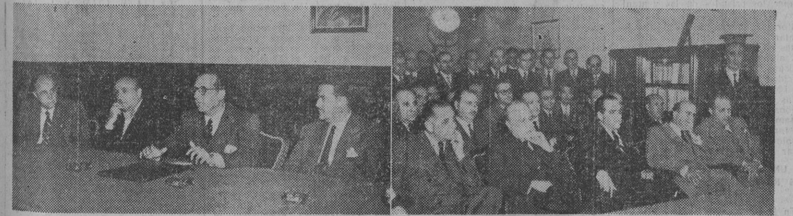
El ministro de Información y Turismo, señor Arias Salgado, durante su discurso de clausura. — II. Un aspecto del salón de actos del Ateneo durante la ceremonia.