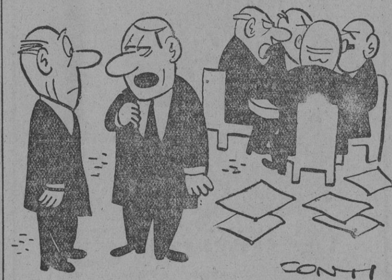
— Sólo se han puesto de acuerdo en escoger el sitio donde habrán de continuar estas conversaciones.