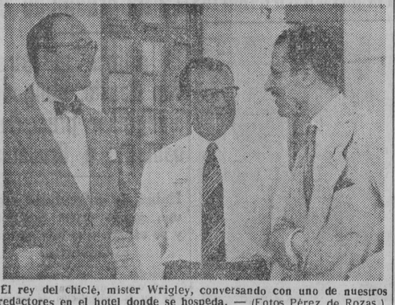
El rey del chicle, mister Wrigley, conversando con uno de nuestros redactores en el hotel donde se hospeda.