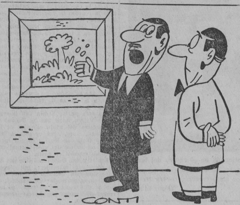
— ¿Dices que este cuadro no vale nada? ¡Tiene el inmenso mérito de haber sido pintado en dos minutos, quince segundos, dos quintos!