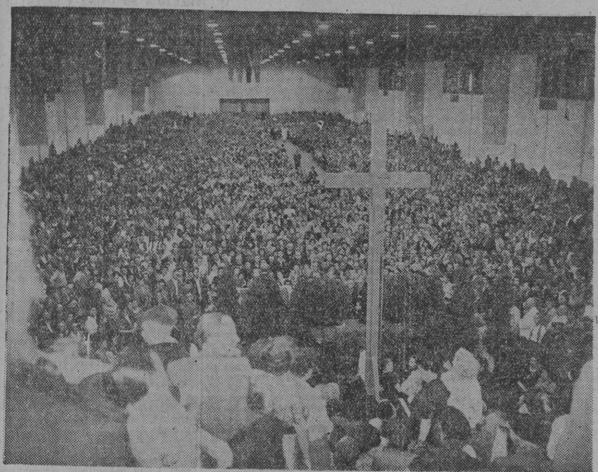
Una ingente multitud escucha la palabra del obispo Paul Tkotsch durante el Congreso Católico Alemán, recientemente celebrado en el Berlín occidental.

EL CONGRESO CATOLICO DE BERLIN Esta mañana embarcó en el yate "Azor" con rumbo a La Coruña