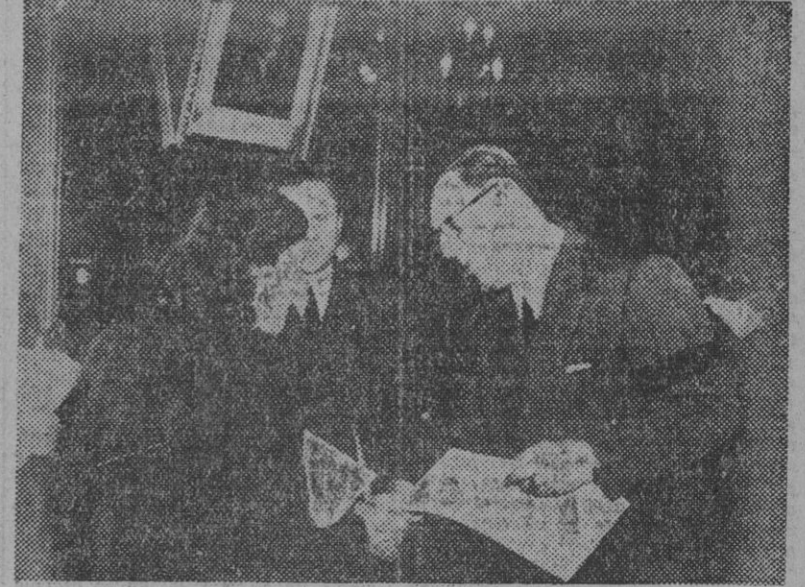
El presidente Perón, desde la muerte de su esposa, dedica tres días de la semana al despacho de los asuntos de ayuda social que Eva Perón había conducido en vida. Aquí vemos al general en plena tarea.

Perón asume la tarea social de su esposa