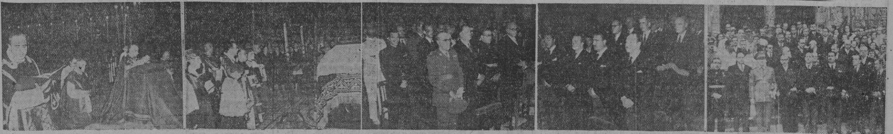
Organizado por el Consulado general de la República Argentina en nuestra ciudad, ha tenido efecto esta mañana, en la Catedral basílica, un solemne funeral por el alma de Doña Eva Duarte de Perón, fallecida en la Argentina, hoy hace un mes. Al acto han asistido nuestras primeras autoridades, representantes consules, colonia argentina y numeroso público. La información gráfica muestra: I. El obispo de la diócesis, doctor Medrego, que ha asistido de capa Magna al funeral, arrodillado ante el catafalco. — II. Un momento del responso, cantado al finalizar la misa. — III. Fotografía del acto. — IV. Cuerpo consular, acreditado en Barcelona. — V. Las autoridades y representaciones oficiales a la salida del templo. — (Fotos Pérez de Rozas.)