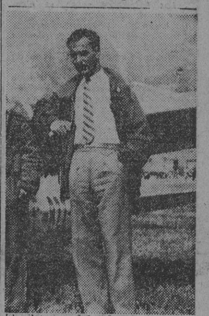
El piloto español señor Juez, que se ha proclamado campeón del Mundo en la categoría de veleros bípiza