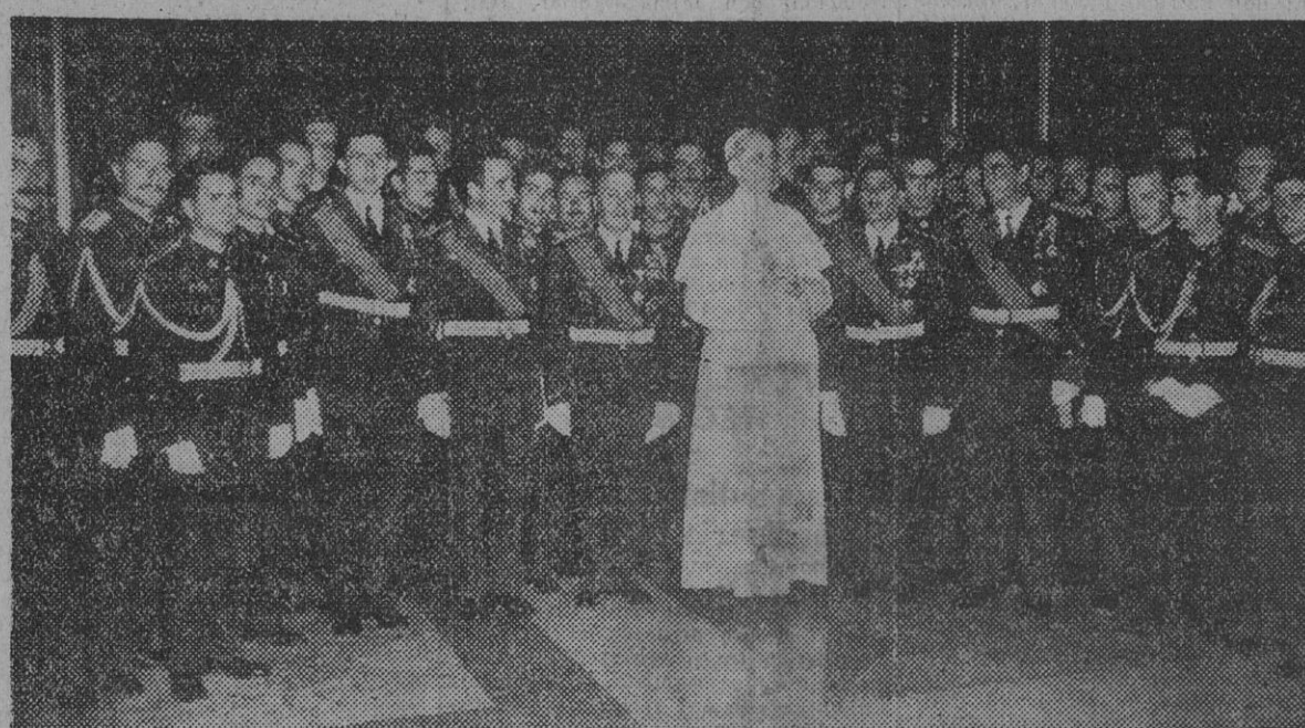
S. S. el Papa Pío XII, rodeado de los oficiales y cadetes de la Aviación española, durante la audiencia a que S. S. concedió a los aviadores de nuestra Patria, el pasado día 2 de julio.

S. S. el Papa recibe a un grupo de cadetes de la Aviación española