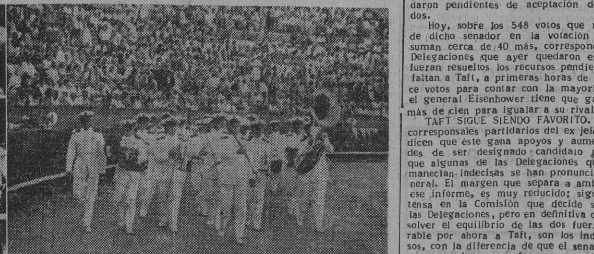
1. El general Mac Arthur durante un momento de su discurso pronunciado en la Convención Nacional de Chicago, en el transcurso del cual atacó duramente la política del presidente Truman. — II. El pasado domingo, en la plaza de toros de Palma de Mallorca y entre la corrida celebrada en dicho día, la banda de música del buque-escuela norteamericano "Empire State", mientras el público aplaudía a los marinos yanquis.