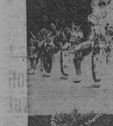
Una escena de "Holiday on ice", el espectáculo excepcional sobre hielo, en el que figuran artistas de veinte naciones distintas

de ver en Valencia a donde se trasladó con ese exclusivo objeto.