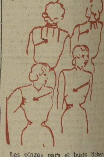
Las pinzas para el busto deberán ser tanto más profundas y cortas cuanto más el busto sea alto y pronunciado, y más largas, si es bajo.

Vamos con una pequeña clase de corte; pequeña pero importante. A menudo encontramos en el cuerpo de cualquier prenda, algo que no sienta bien, que le falta o le sobra. Son generalmente unas pinzas no colocadas en el sitio adecuado. Las imperfecciones del busto se remedian recurriendo a pinzas; y embobidos, que suelen ser la salvación en las hechuras, y de las que tanto abusan nuestras modistas, ya que de ellas depende el "buen sentido" de una prenda. Cuando se es un poco cargada de espaldas, hay que colocar en el mismo cuello, dos pinzas pequeñas, y alargadas, partiendo de la costura de los hombros, y otras dos a una pequeña distancia más al centro, y algo más cortas. Cuando la nuca es gruesa hacen en la mitad del cuello por detrás, tres pinzas cortas, en forma de abanico y bien aplastadas con la plancha. Si se tiene el busto delgado y el estómago pronunciado, hacer una pinza a cada lado del delantero, y otras tres se sacarán de la costura de debajo del brazo. Para dar holgura y disimular un busto fuerte, hacer tres pinzas en