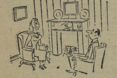
Tienes razón, querido; si me hiciera los vestidos yo misma, me resultarían más baratos... pero habrás de admitir que economizaríamos todavía más si yo te hiciera los trajes.