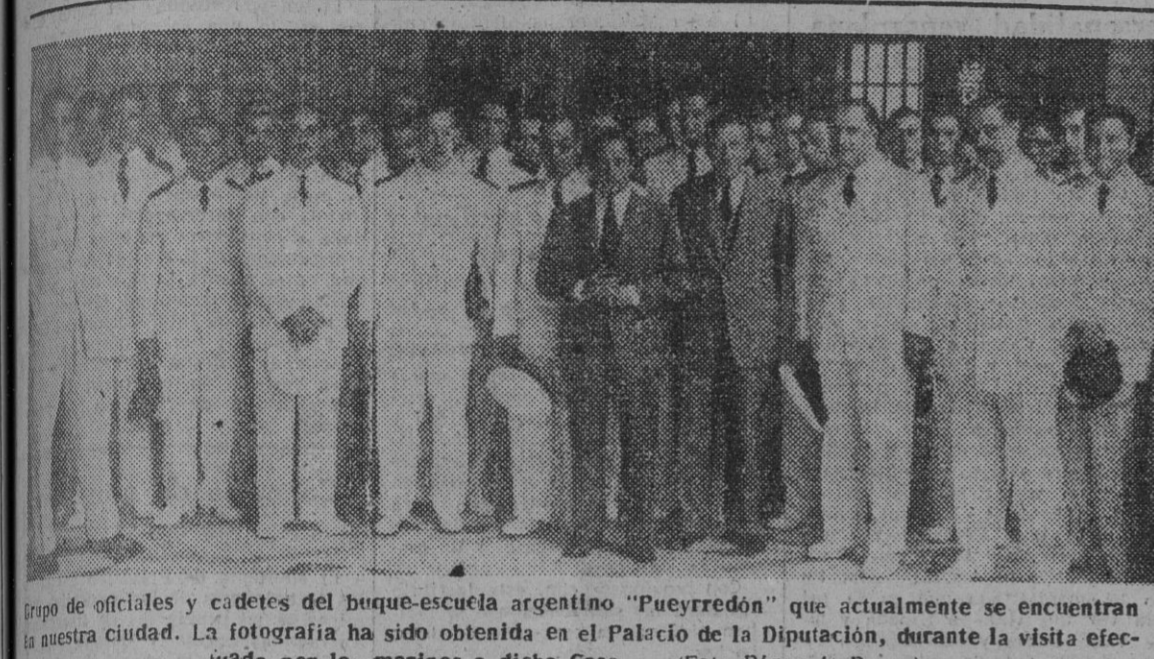
Grupo de oficiales y cadetes del buque-escuela argentino "Pueyrredón" que actualmente se encuentran en nuestra ciudad. La fotografía ha sido obtenida en el Palacio de la Diputación, durante la visita efectuada por los marinos a dicha Casa.