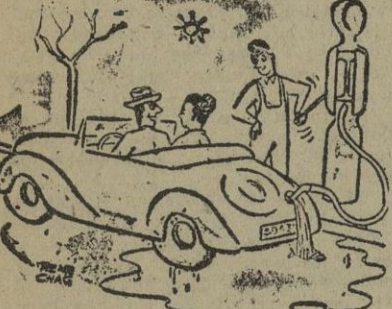
No me negarás que has impresionado al expendedor.