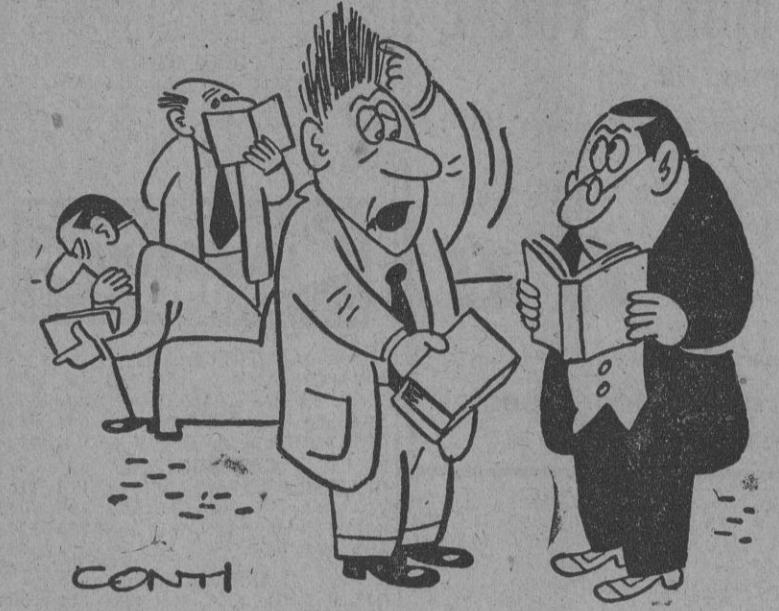
— Yo creo que ésta es la mejor que han enviado al Certamen. Fíjese cómo se me ha puesto el pelo al leerla.