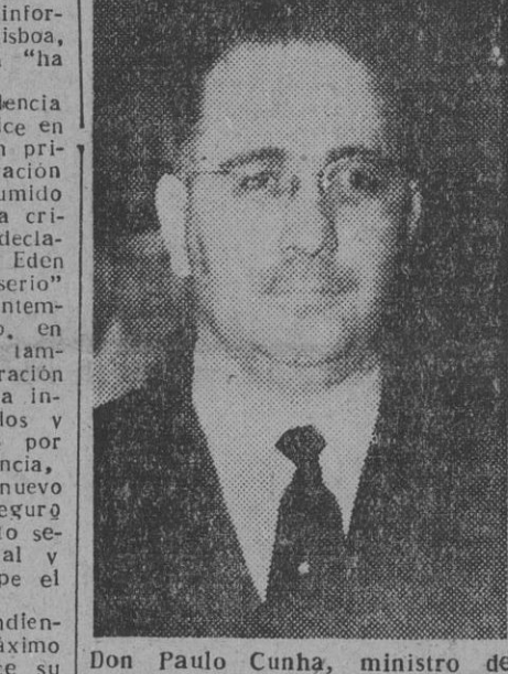
Don Paulo Cunha, ministro de Asuntos Exteriores de Portugal

tal. Se comprende muy bien que Portugal insista particularmente sobre la cuestión cuando ella misma, como miembro de la N.A.T.O., deberá conciliar las obligaciones que le impone el Pacto con las que se derivan del pacto de no agresión y amistad que firmó con España en 1939 y que fue renovado después. Sea cual fuere la acogida que eventualmente tenga en Lisboa la petición portuguesa, su suerte dependerá, ante todo, del giro que tomen las negociaciones, de las que se viene habiendo desde hace tiempo, entre Madrid y Washington.