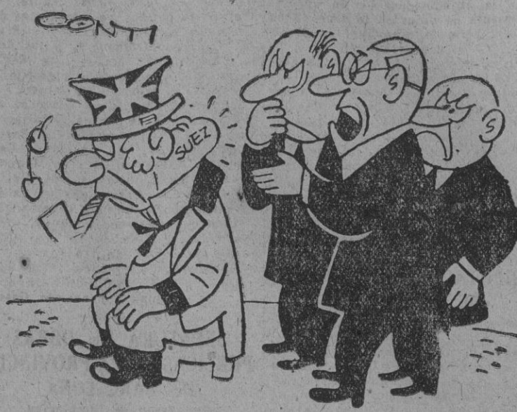
— Extirparlo es peligrosísimo y no extirparlo gravísimo.

Ayer se pusieron de acuerdo en "algunos puntos de poca importancia"