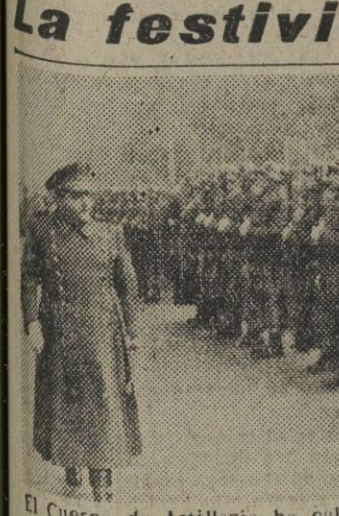
El Cuerpo de Artillería ha celebrado hoy la festividad de Santa Bárbara, su Patrona. I. El capitán General revista al regimiento formado en el Paseo de Gracia. — 2. El altar de la iglesia de los Padres Carmelitas, adornado durante la función religiosa de esta mañana.