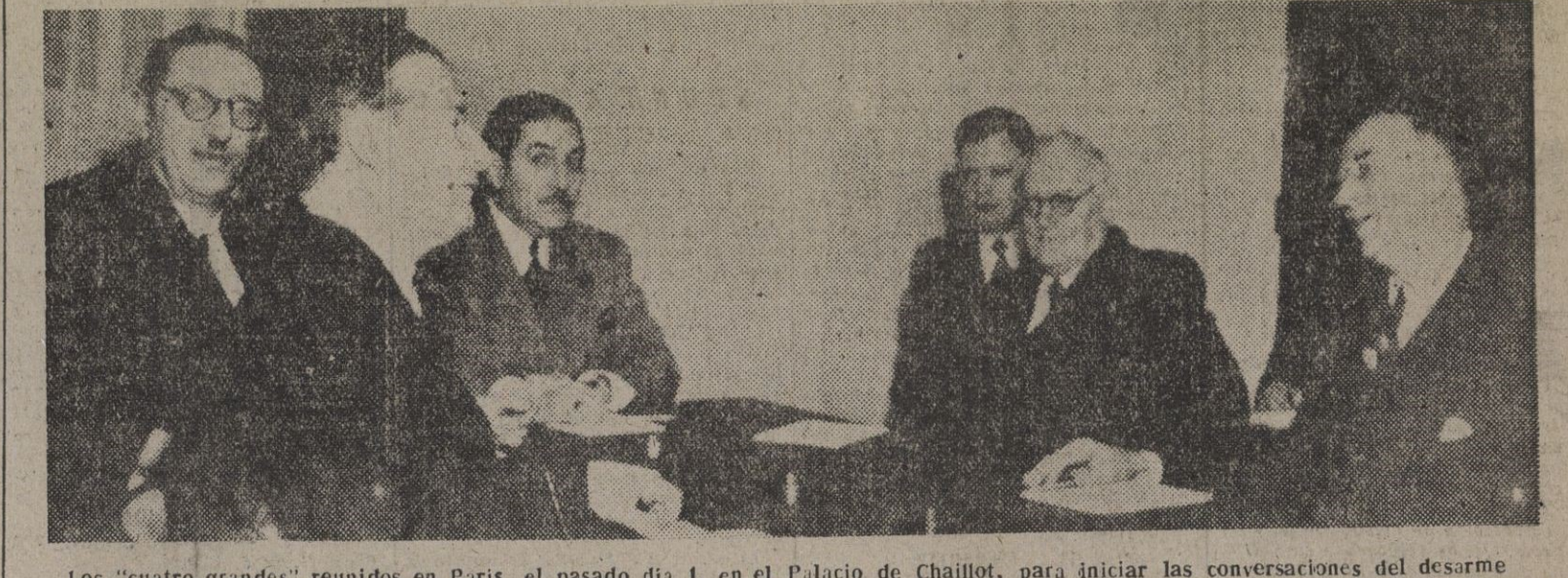
Los "cuatro grandes" reunidos en París, el pasado día 1, en el Palacio de Chaillot, para iniciar las conversaciones del desarme

Conversaciones para el desarme, en París