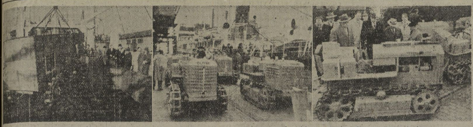
Mañana han sido descargados, en nuestro puerto, 110 tractores americanos, adquiridos por el Ministerio de Agricultura para ser distribuidos entre los agricultores españoles.