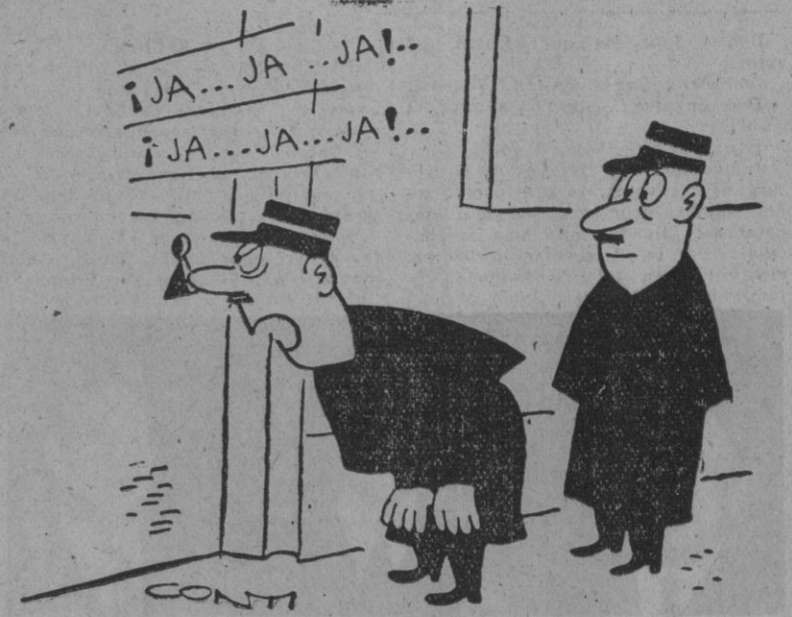
— No te hagas ilusiones. Lo que ocurre es que al terminar la sesión se explican unos cuantos chistes para salir con la cara sonriente.