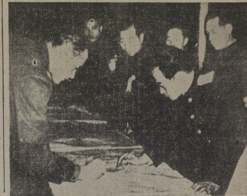
Oficiales norteamericanos y el representante de las Naciones Unidas, un coronel norteamericano, estudian sobre el mapa los puntos y líneas para la fijación, por ambas partes, de los límites en el frente de Corea. Los trabajos que se concertaron en las innumerables reuniones y que parecían haber hallado un camino viable para una definitiva tregua, se han visto más tarde anulados por la disconformidad del ejército rojo, que ha obstaculizado, una vez más, los deseos de paz de la O. N. U.