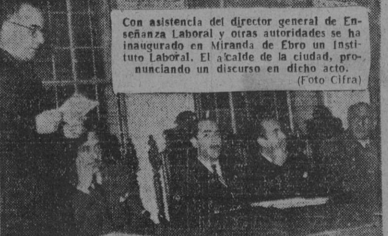
Con asistencia del director general de Enseñanza Laboral y otras autoridades se ha inaugurado en Miranda de Ebro un Instituto Laboral. El alcalde de la ciudad, pronunciando un discurso en dicho acto.

El general Bradley conferenciará hoy con los jefes de Estado Mayor británicos