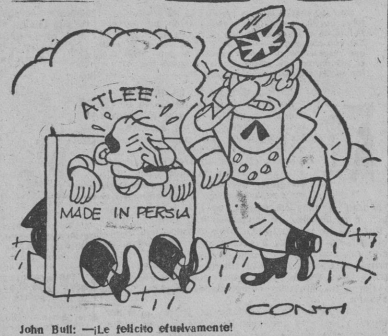
John Bull: —Le felicito efusivamente!