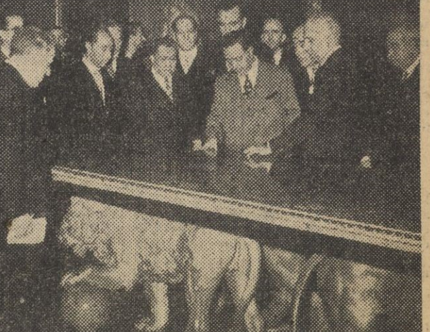
El presidente de Filipinas, acompañado del ministro de Educación Nacional, señor Ruiz Jiménez; director general de Bellas Artes, señor Gallego Burin; del director del Museo, señor Alvarez de Sotomayor, y otras personalidades, durante su visita a la pinacoteca del Prado