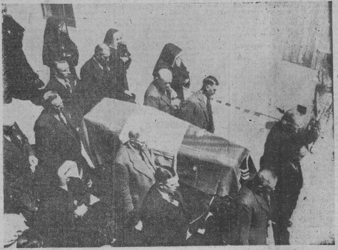
El féretro de Pétain conducido por veteranos de guerra al cementerio de Joinville, en la isla de Yeu

Traslado de los restos del mariscal Pétain