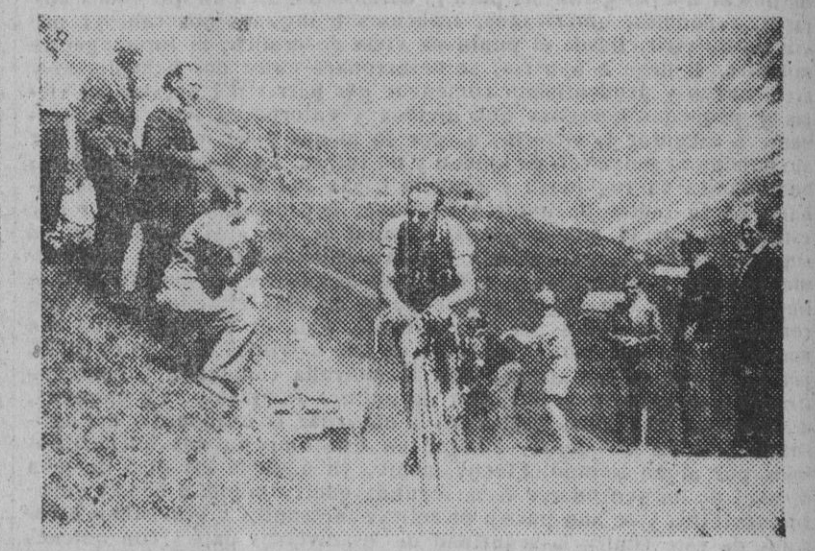
Koblet, el formidable ciclista suizo, gran triunfador de la Vuelta a Francia.

rencias que separaban a unos de otros. ¿SE JUSTIFICA EL PASO POR LOS ALPES? Mr. Jacques Goddet, director y orientador de la Vuelta Ciclista a Francia, ha puesto un interés extraordinario en convertir la ronda en carrera rápida. Desde hace muchos años viene trabajando para borrar el sello torpe que pesa sobre la misma, eliminando aquellas circunstancias que le dieron esa fama. Influyó mucho cerca de Mr. Desgrange para