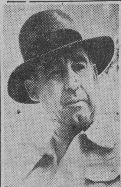
El nuevo presidente de la República de Portugal, don paisano, general Francisco Higinio Craveiro Lopes. Hele aquí veraneando en un lugar cercano a Lisboa.