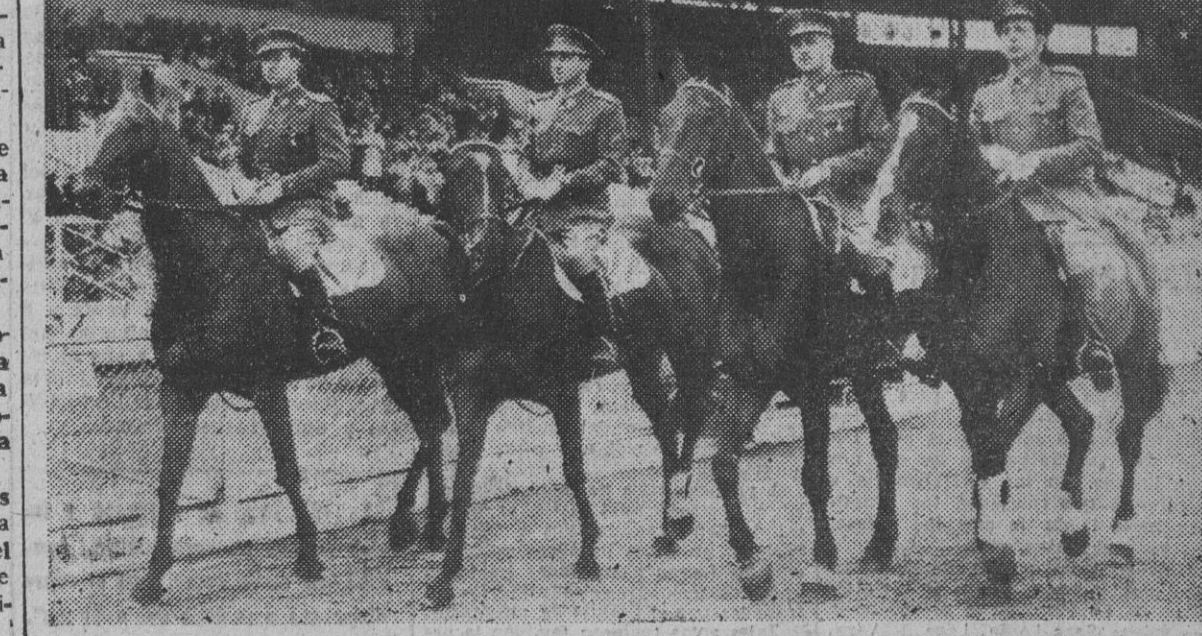
El equipo español que tomó parte en la Copa del príncipe de Gales.