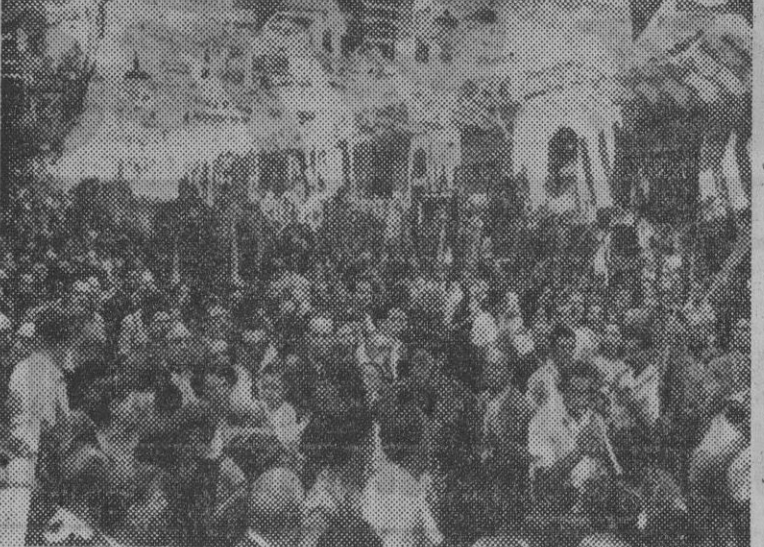
Un aspecto de la concentración de Coros de Pueblo Seco