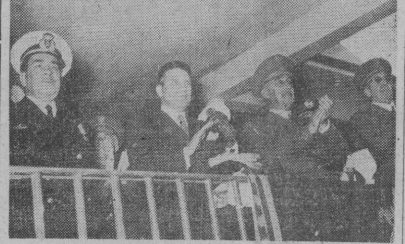
S. E. el jefe del Estado con el ministro portugués de Defensa, señor Santos Costa, y otras personalidades, durante la celebración del Concurso Hípico Internacional.