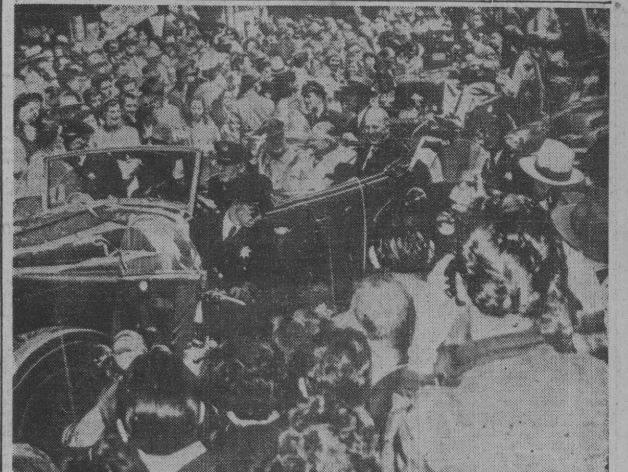
Mac Arthur, junto al alcalde Elmer Robinson y el gobernador Earl Warren, corresponde a las aclamaciones del público a su paso, en coche descubierto, por las calles de San Francisco.