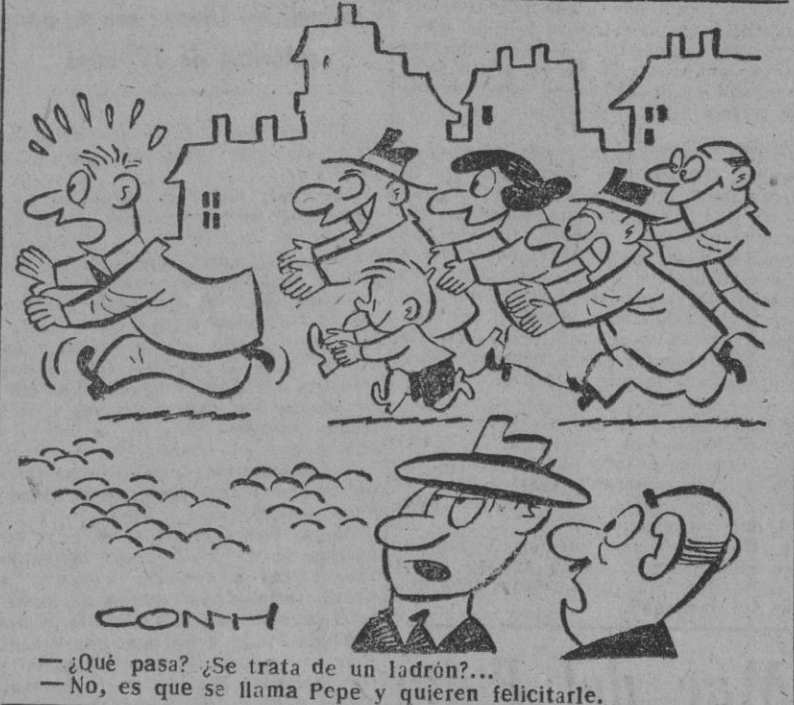
—¿Qué pasa? ¿Se trata de un ladrón?... —No, es que se llama Pepe y quieren felicitarle.