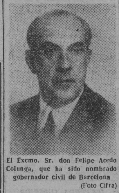
El Excmo. Sr. don Felipe Acedo Colunga, que ha sido nombrado gobernador civil de Barcelona

¡¡Católico!!! ¿Buscas la Obra más grata a Dios, para ayudarla? Esa Obra la tienes en el Seminario.