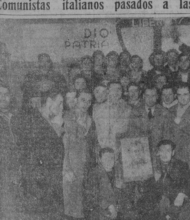
En Gravina di Puglia, doscientos treinta miembros del partido comunista han hecho entrega de sus carnets al vicesecretario de la sección local del partido cristiano-demócrata que acudilla el primer ministro Alcide De Gasperi, cuyo retrato aparece a ntre este grupo de sus nuevos afiliados.

Comunistas italianos pasados a las filas demócratas