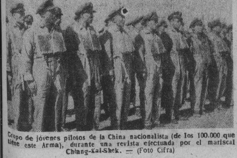
Grupo de jóvenes pilotos de la China nacionalista (de los 100.000 que tiene este Arma), durante una revista efectuada por el mariscal Chiang-kai-Shek.