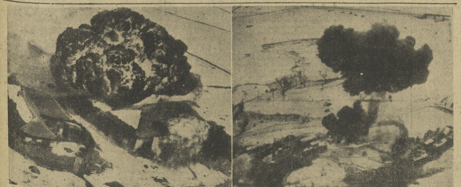
Las bombas «Nepalm», de gasolina gelatinosa, constituyen una de las armas más poderosas empleadas por los americanos en Corea. En las fotos se aprecian sus efectos sobre casas en las que se ha advertido la presencia del enemigo y que ardió totalmente por la amplia onda explosiva.