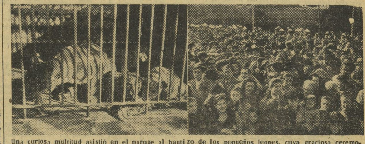
Una curiosa multitud asistió en el parque al bautizo de los pequeños leones, cuya graciosa ceremonia fue realizada por los miembros del «Arca de Noé». Uno de los leoncitos, que aparece fotografiado con sus hermanos en la jaula, recibió el pomposo nombre de «Pim, Pam, Pum».