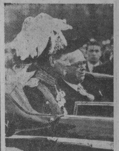
El rey Federico IX de Dinamarca y su esposa han llegado recientemente a París en viaje oficial. En la fotografía aparece el monarca acompañado de Vincent Auriol, al salir de la estación camino de la residencia que les ha sido preparada en París

aunque los Estados Unidos vencieran a la China comunista saldría debilitada de la lucha, pero Rusia seguiría incólume, su fuerza intacta y vendría a ser la mayor Potencia del Mundo. Rusia habría ganado el juego sin sacrificar un solo soldado soviético.