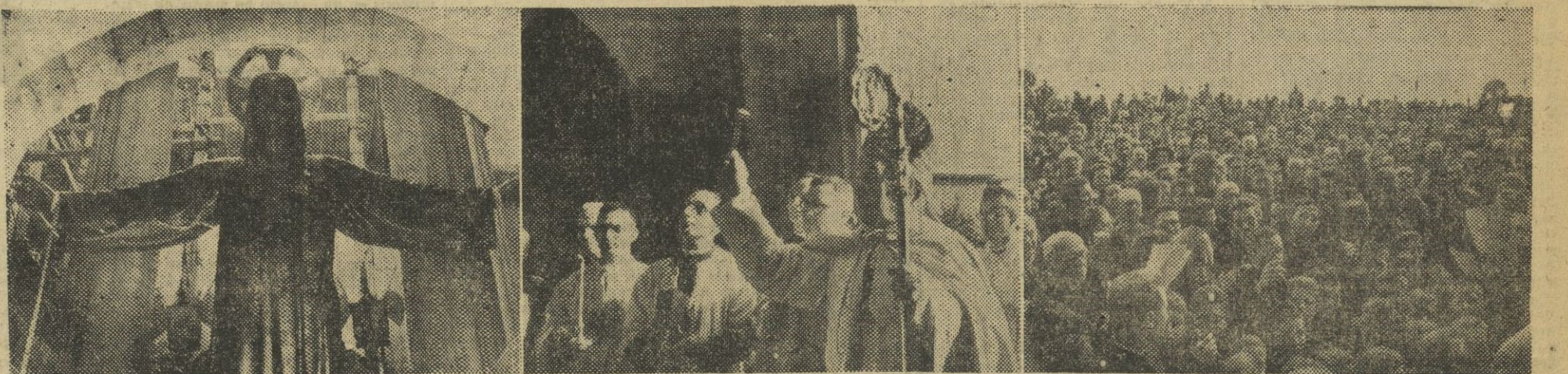
La información gráfica recoge tres momentos de la solemne bendición de la imagen del Sagrado Corazón de Jesús en la cumbre del Tibidabo. 1. La monumental figura del Sagrado Corazón de Jesús. — 2. El doctor Modrego, obispo de Barcelona, bendiciendo la imagen. — 3. Un aspecto de la plaza del Tibidabo llena de numerosos fieles que asistieron al acto.