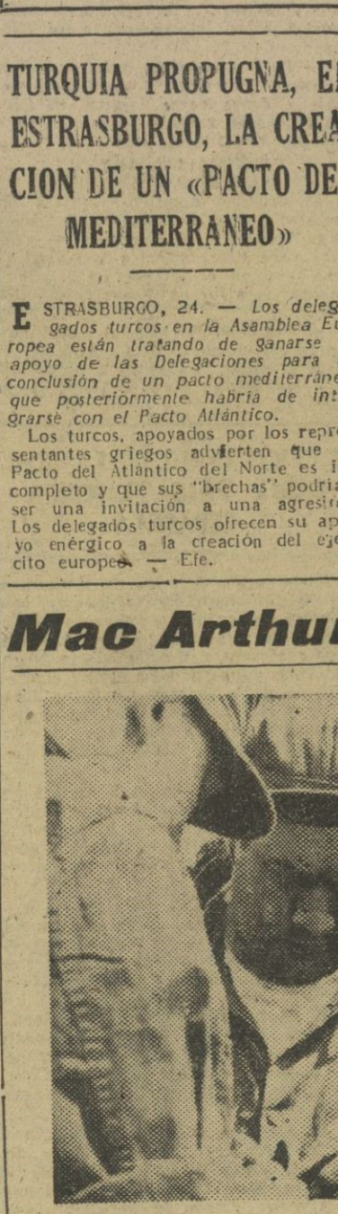
El general Douglas Mac Arthur, celebrando una conferencia de Prensa con los corresponsales destacados en el frente de Corea