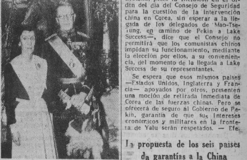
Ultima fotografía del rey Gustavo VI y de la reina Luisa, de Suecia. La reina Luisa, de soltera lady Louise Mountbatten, es hija del primer marqués de Milford Haven, y hermana del conde de Mountbatten.

Ultima fotografía de los reyes de Suecia