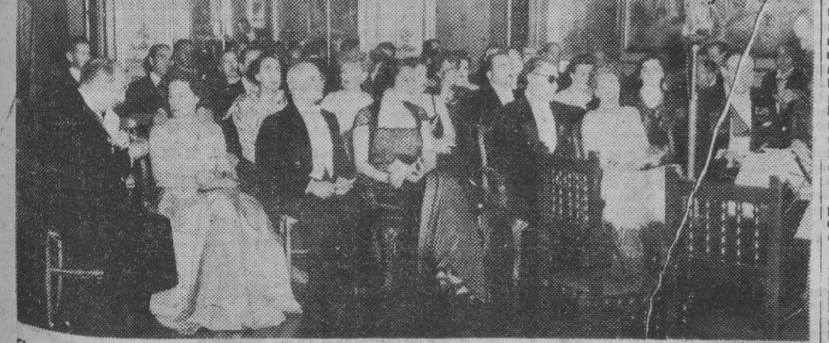
El Dr. Taha Hussein Bey, acompañado del ministro de Educación Nacional, señor Ibañez Martín, durante la recepción que le fue ofrecida por el ministro de Asuntos Exteriores, que también aparece en la fotografía.