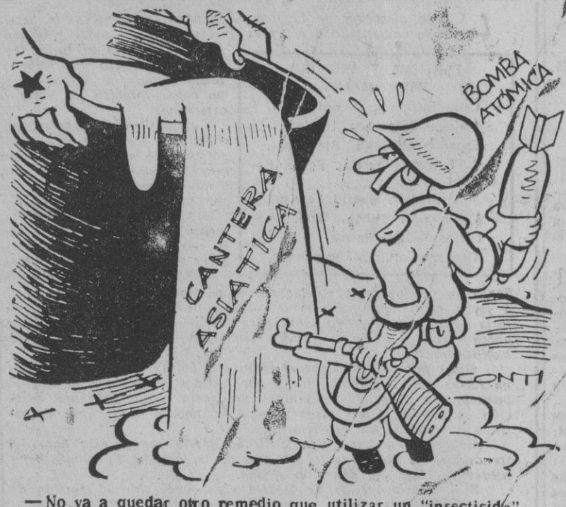
—No va a quedar otro remedio que utilizar un "insecticida".