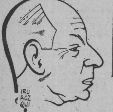
IRU RÓZ QUI

Vendió joyas al rey Faruk, al sha de Persia y al Aga Khan