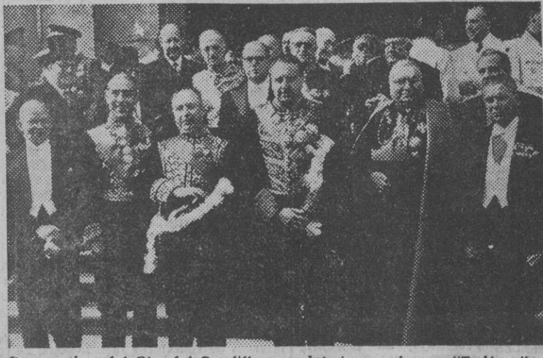
Con motivo del Día del Caudillo se celebró un solemne "Tédéum" en San Francisco el Grande. En la foto vemos al Cuerpo Diplomático acreditado en España, con el ministro de Asuntos Exteriores, señor Martín Artajo, a la salida del templo.