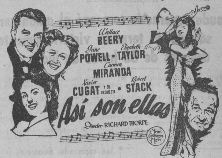
Un plantel de artistas como pocas veces nos ofrece la pantalla, en una comedia infinitamente amena y amable, que divertirá y emocionará

METRO-GOLDWYN-MAYER PRESENTAN HOY, NOCHE, A LAS 1030 la gran comedia musical, de ritmo juvenil y ultramoderno