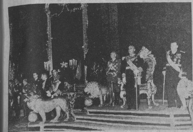
Otro aspecto de la recepción celebrada ayer en el Salón del Trono del Palacio de Oriente.