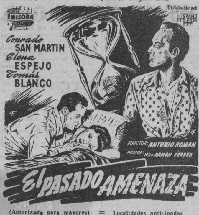
(Autorizada para mayores) = Localidades anticipadas

Un arte de técnica cinematográfica, en un tema apasionante de suprema originalidad