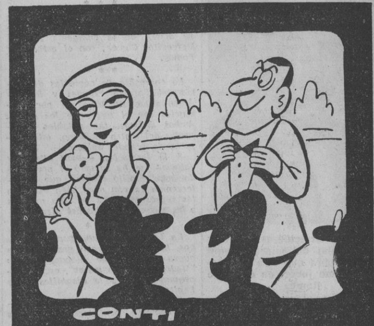
— Ahora viene lo más bonito de la película. — ¿Le declaras el su amor? — ¡No seas vulgar, hombre! La estrangula.