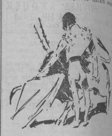
Uno de los clásicos naturales de Rafael Llorente (Apuntes del natural por R. Saura)