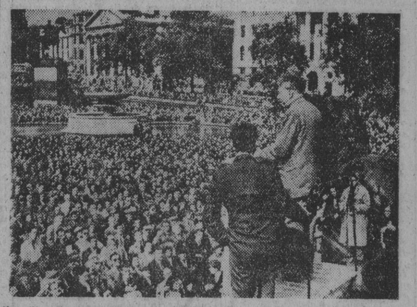
Ilya Ehrenburg, conocido escritor y propagandista soviético, portavoz número 1 de Stalin, ha dado en Londres un mitin al pie de la estatua de Horacio Nelson, acusando al imperialismo norteamericano de la guerra en Corea y poniendo cínicamente de relieve los deseos de paz de Rusia.

Mientras los soldados ingleses combaten en Corea