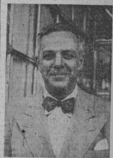
El profesor Alton Ochsner, catedrático de la Universidad de Tulone (Nueva Orleans) y el cirujano de mayor prestigio de los Estados Unidos en la especialidad de torax, que se encuentra actualmente en Madrid.