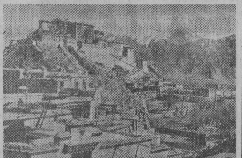
Una vista de la ciudad sagrada de Lassa, capital del Tibet. Pocos son los informes que se poseen de la vida en esta misteriosa ciudad, así como en general de todo el Tibet, por las dificultades físicas de acceso y por la prohibición de entrada para todos los extranjeros. Algunas Misiones inglesas y alemanas — sobre todo la alemana de 1938-1939 — han servido para una mejor información de lo que es "el misterio del Tibet", donde hoy han entrado 20.000 comunistas chinos.

HONG-KONG, 14. — En relación con la noticia de que 20.000 soldados del ejército comunista chino han entrado en el Tibet, que es acogida con la mayor de las reservas en los medios militares extranjeros de Hong-Kong.