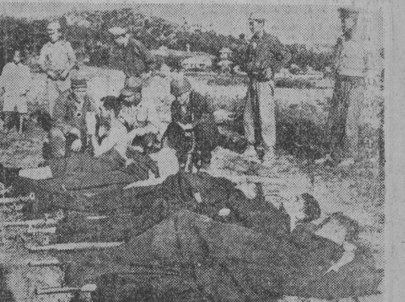
Seul, antes de su retirada de la capital.