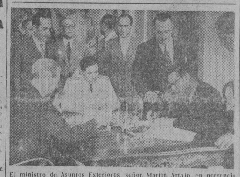
El ministro de Asuntos Exteriores, señor Martín Artaño, en presencia del ministro del Aire, general Gallarza, entrega la Nota al encargado de Negocios de los Estados Unidos, señor Culbertson.