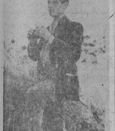
Al frente de los cuales se encontraba el coronel Lucca, que dirige desde hace un año los movimientos de las fuerzas de represión del banditismo en Sicilia.

Según los primeros informes, parece que Giuliano cayó en una emboscada tendida por los "carabinieri".