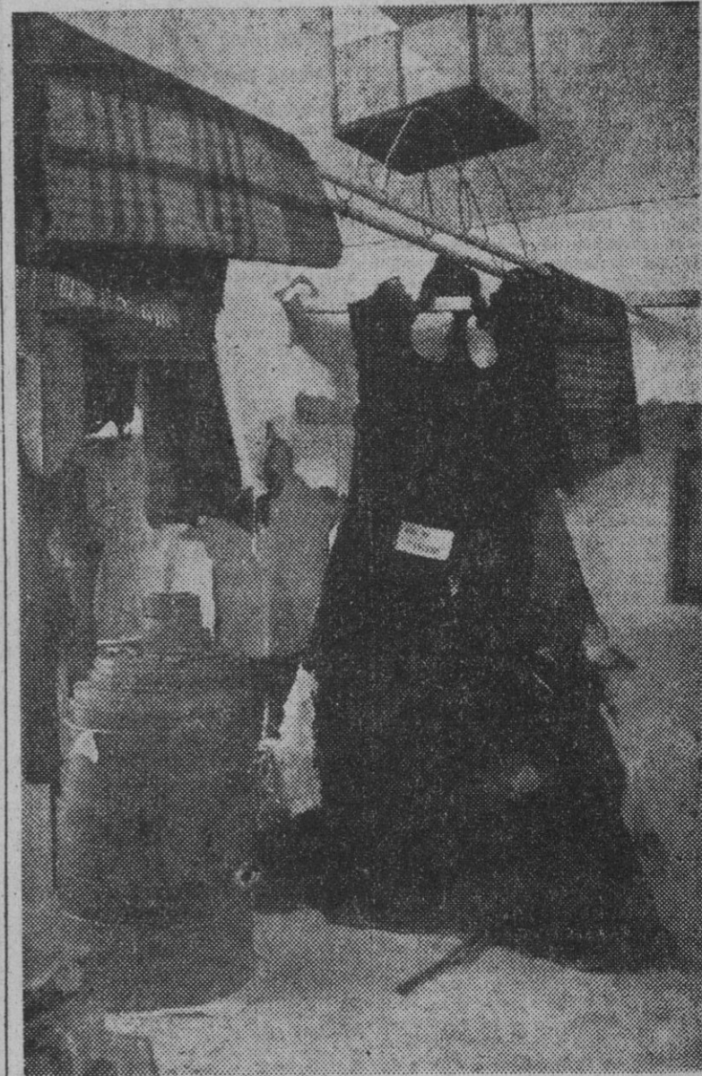
En el pabellón de Segovia, de la Feria Nacional del Campo, y en el lugar destinado a una fábrica de curtidos de dicha provincia, se exhibe la piel del toro "Islero", que mató a "Manolete" en la Plaza de Linares.

SI NO LA COMPRARA NADIE SE DESTINARIA A LA FABRICACION DE CORREAS