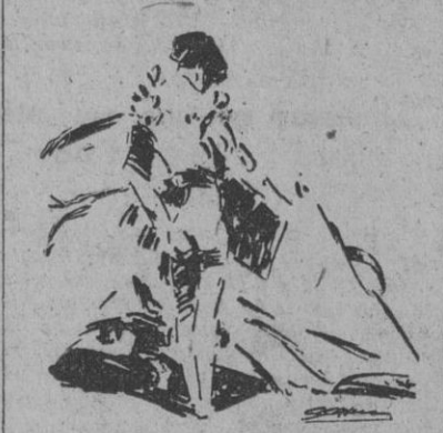
Un lance de Antonio Ordóñez (Apuntes del natural por R. Sevilla)

Si en su primero, Pablito Lalanda desagrada al concurso que casi llegaba las Arenas y con el que no pudo a causa de su mucha fuerza, genio bastante y achuchar no poco por ambos lados, pese a su bravura que corrió parejas con la del tercer astado, y al que despenó con un pinchazo y no la estocada se adjudicó el triunfo completo con su segundo, o sea el cuarto. Fué su labor con la muleta, inteligente y elaborada a base de valentía. Aguardado en tablas, allí le hizo embestir y pasar varias veces con evidente soltura y serenidad hasta provocar el entusiasmo de