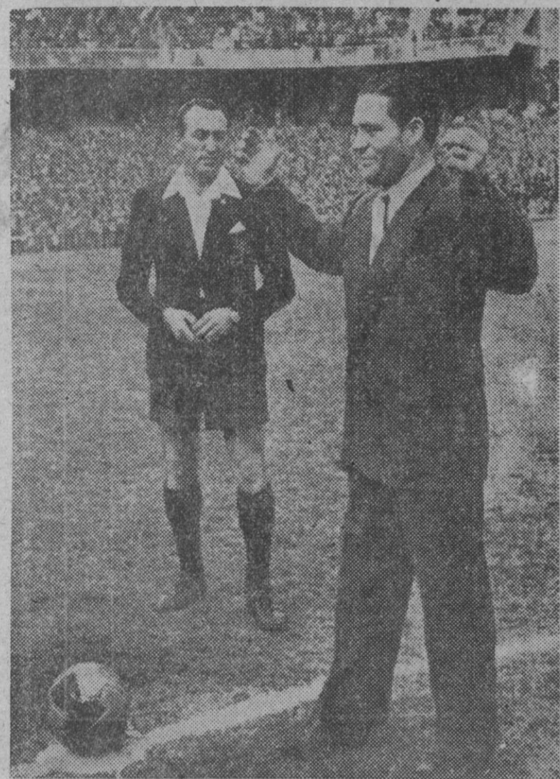
Antes de comenzar el partido Atlético-Madrid, salió al centro del campo el campeón de Europa de Boxeo, el catalán Romero, que recibió los aplausos de la multitud por su brillante actuación últimamente en Londres.

EL CAMPEON DE EUROPA DE BOXEO, ROMERO, ACLAMADO EN EL ESTADIO DE CHAMARTIN