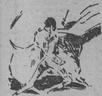
Un pase por alto, de rodillas, de Pablo Lalanda

El día del Corpus que, este año, se celebra el 8 de junio, habrá sido el de su alternativa. En la Imperial Toledo, teniendo como padrino al gran