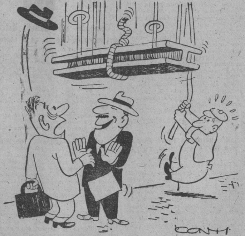
—¿Dice usted que me interesa un seguro? ¡Pero si a mi nunca me ha sucedido nada!