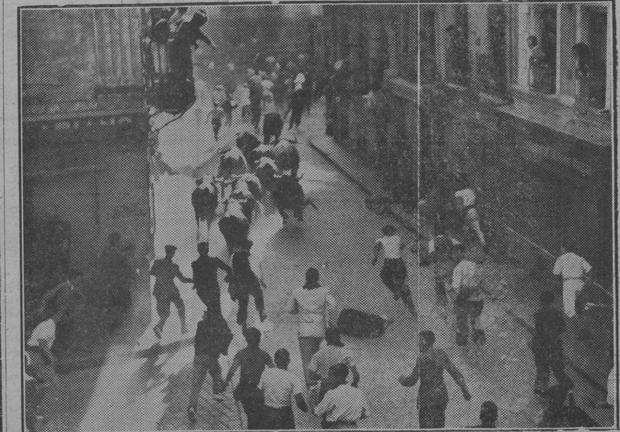
A gran íre, este lote de "irunxemes" se lanza Estafeta arriba, perseguido por las fieras alcaídas