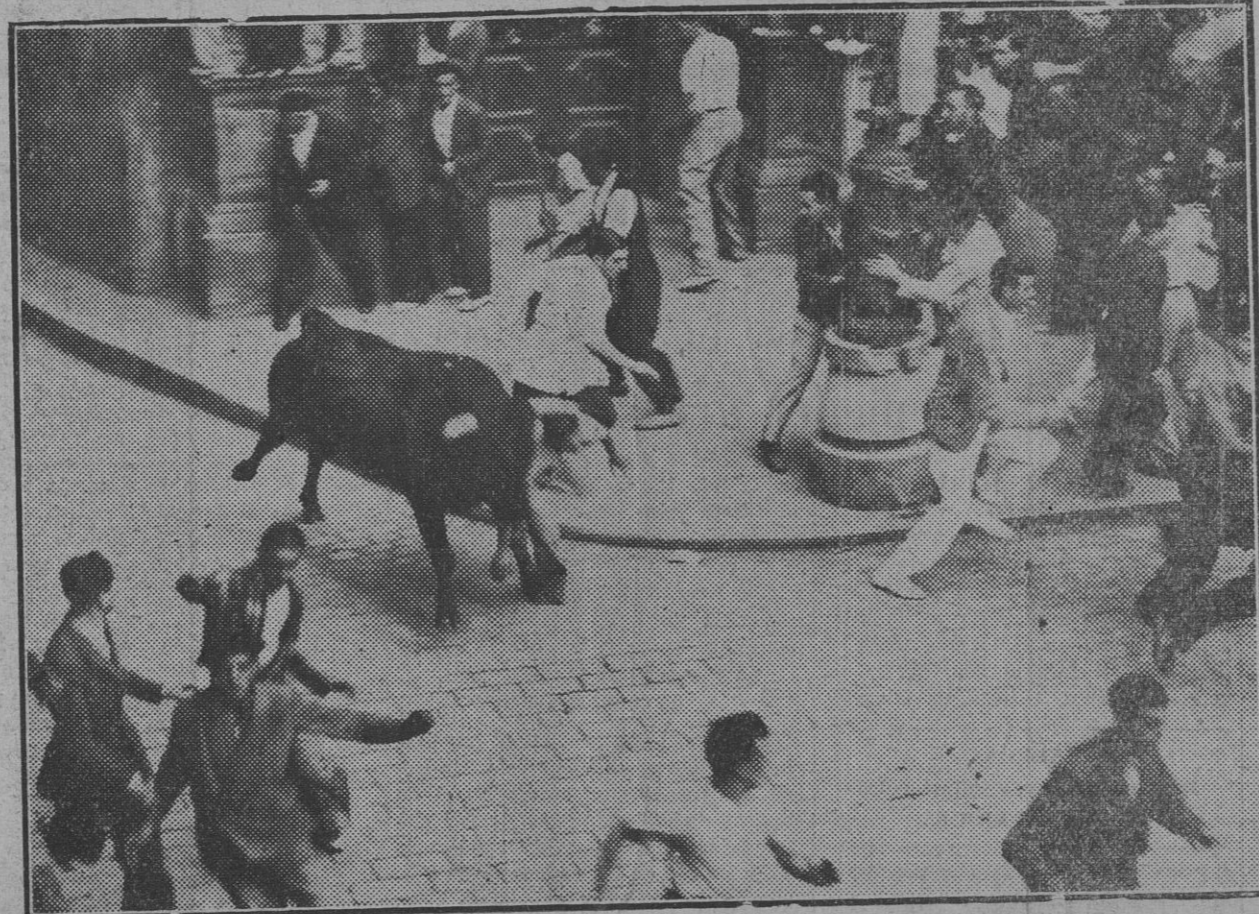
Fué el encierro de los "tasarros" de los que realmente no causan en el momento de entrar en el ruedo emoción de ningún tipo. La foto representa el momento en que uno de los corredores es alcanzado con gran aparato y afortunadamente con poca "avería".

se efectuó sin novedad, pero con notas de intensa emoción en la Plaza del Ayuntamiento y calle de Blanca de Navarra, de alguna de las cuales va en otro lugar del periódico testimonio del sagaz objetivo de Zaragüeta. Tres jóvenes recibieron "caricias" de un astado, pero fueron muy suaves. Terminadas las vaquillas el público llenó cafés y el campo del Ensanche, y las elegantes con ganas de bailar lo hicieron a su sabor en el Nuevo Casino.