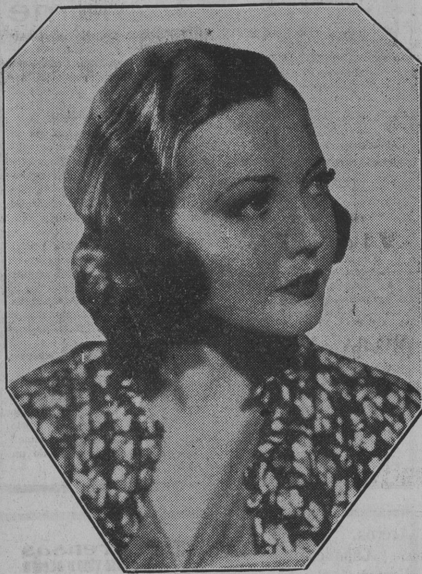
Sylvia Sidney, la gran actriz yanki del cinema-- que era una de las incalificables de Hollywood -- ha contraído matrimonio con el periodista Bennett Cerf.

AÑO XIII.-NUM. 3.908.-APARTADO 29.- TELEFONO 1797