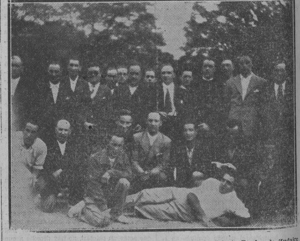
Grupo de profesores y alumnos en las proximidades de la Colonia Escolar de Zudaire