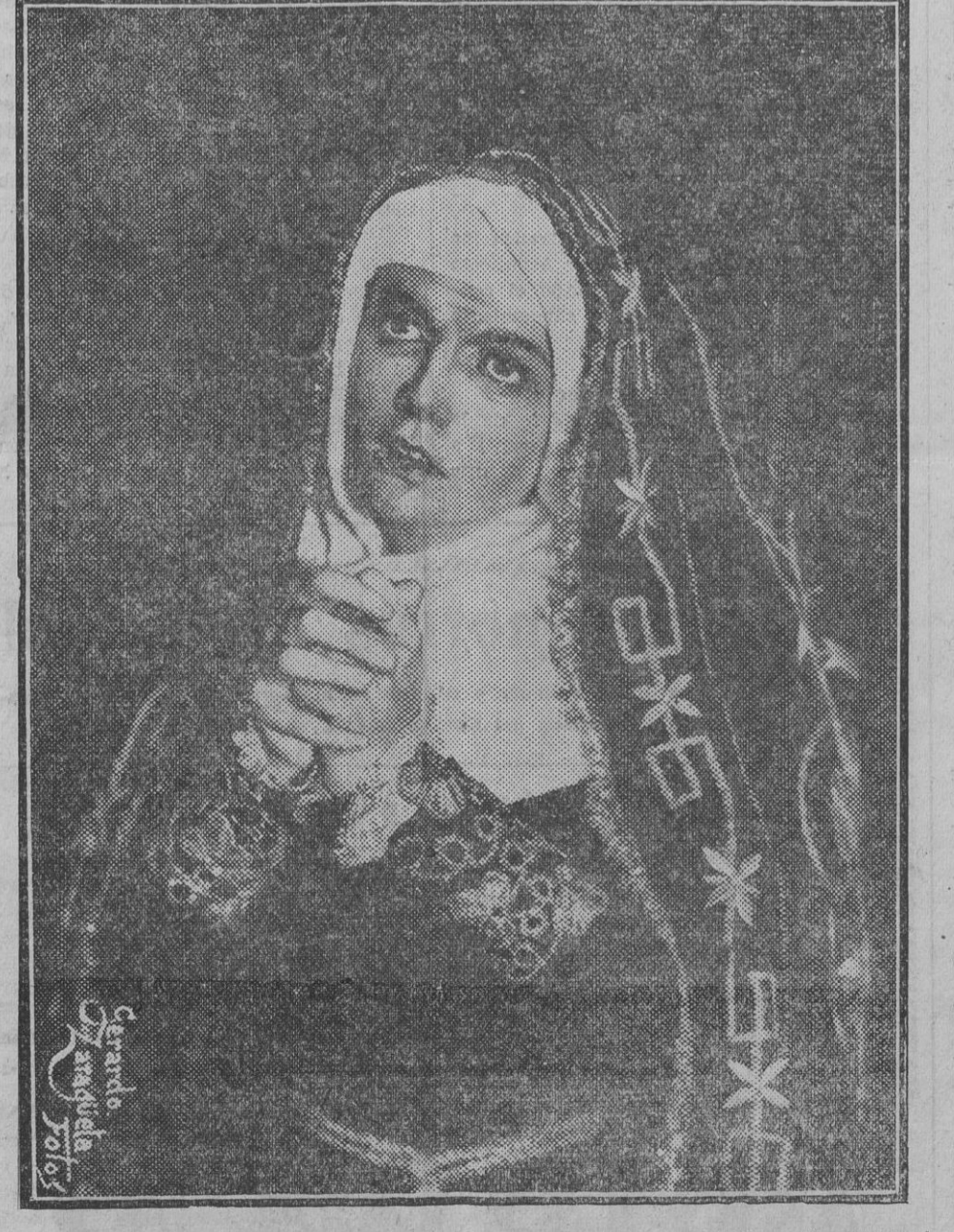
La venerada y bella imagen de "La Soledad" que ayer fué trasladada a la Catedral, acompañada por inmensa muchedumbre.

La Compañía titular del Teatro Romea de Barcelona puso ayer en escena "María la famosa" de Antonio Quintano y Pascual Guillón. Se trata de una comedia de ambiente andaluz en la que se refleja el alma y la vida peculiar de aquella raza. El asunto es ciertamente novelesco y la forma está admirablemente lograda por sus autores, derrochando gracias a veces y una notable agudeza de ingenio. Pero lo más notable de todo es ciertamente el arte de los actores, que dan vida extraordinaria a las escenas, particularmente la primera actriz que consigue una estupenda creación de María, la famosa.