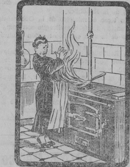
UN BUEN CONSEJO