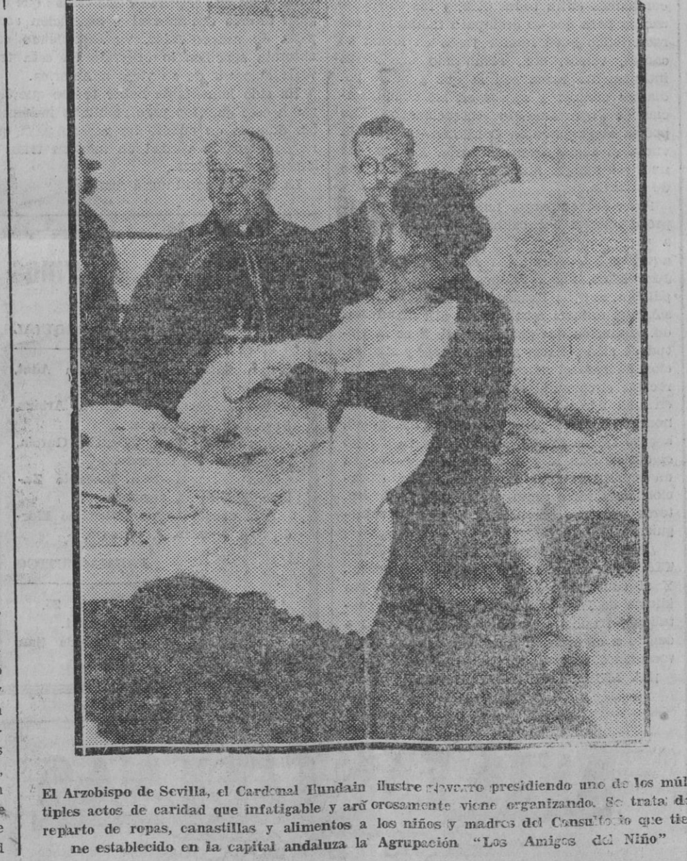
El Arzobispo de Sevilla, el Cardenal Huandín Ilustre presidiendo uno de los múltiples actos de caridad que infatigable y arduamente viene organizando. Se trata del reparto de ropas, canasillas y alimentos a los niños y madres del Consultorio que tiene establecido en la capital andaluza la Agrupación "Los Amigos del Niño"